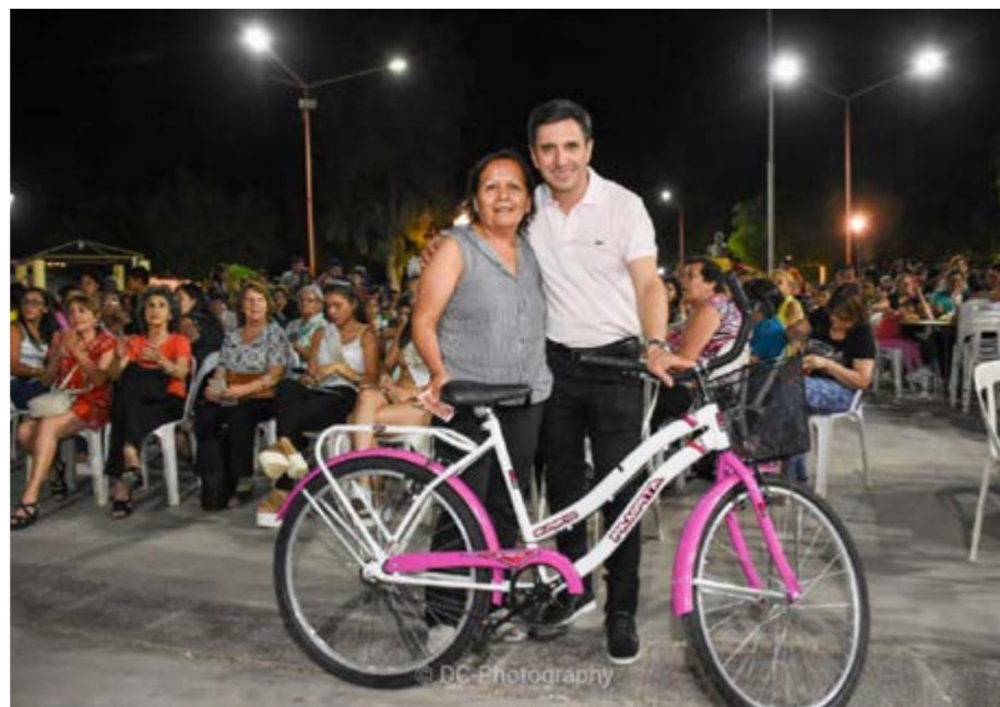
hasta la plaza, encontraron un espacio de esparcimiento y reconocimiento. Para llegar, la comuna dispuso colectivos gratis que recorrieron todo el departamento.