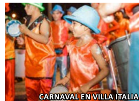
CARNAVAL EN VILLA ITALIA