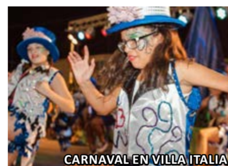
CARNAVAL EN VILLA ITALIA