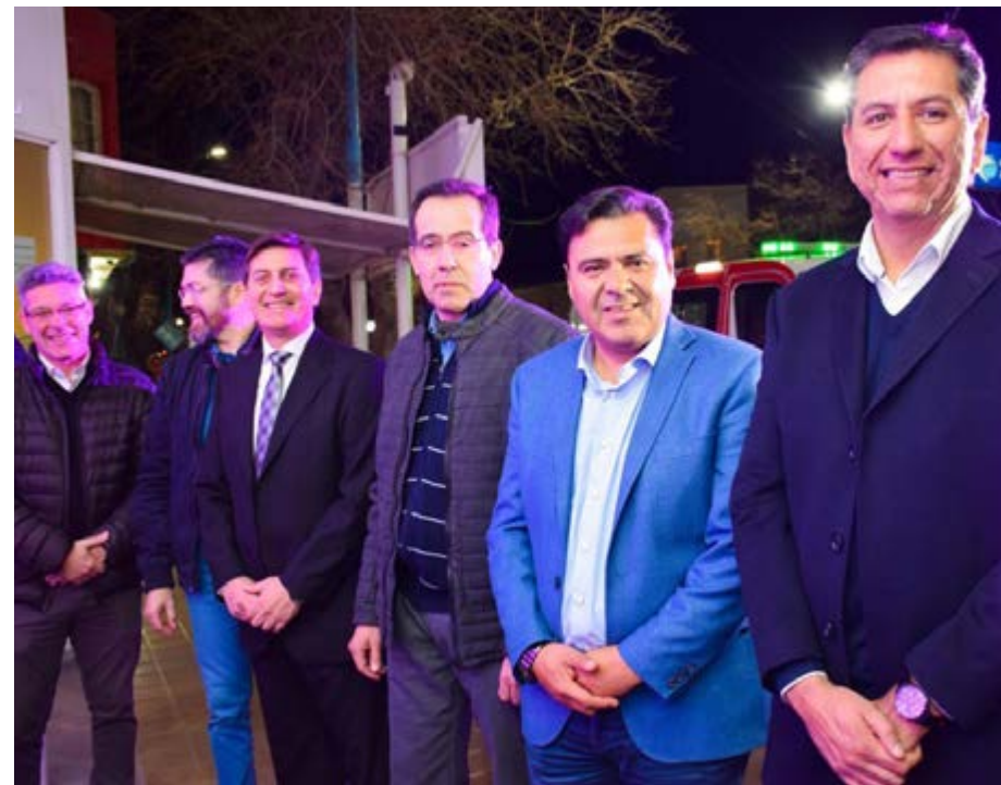
das mejoren el Servicio de Atención primaria de la Comunidad.