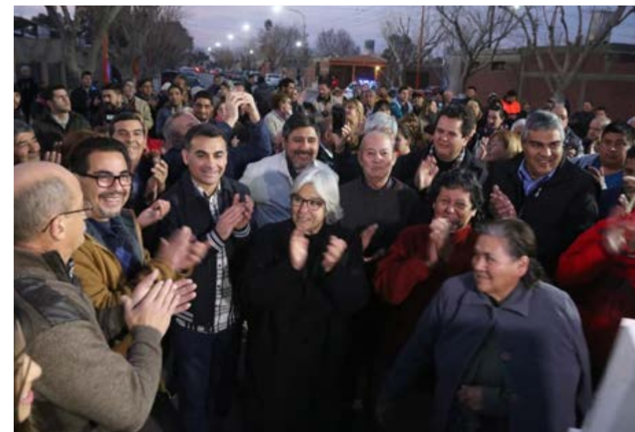
Camping que estará listo a fin de año y como un lugar de encuentro y esparcimiento para todas las familias.

de pavimento tan ansiadas por los vecinos de los Barrios San Francisco I, San Francisco II, y Barrio Banderas Argentinas. “Juntos seguiremos construyendo el Chimbas que todos soñamos”, agregó el Jefe comunal. Por otro lado, avanza la construcción del camping de Villa Observatorio. El Intendente recorrió la obra del nuevo