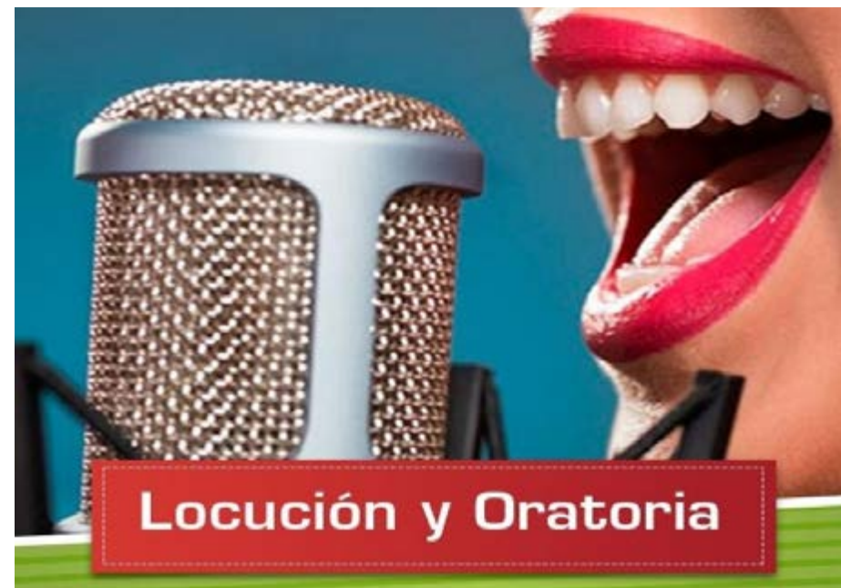
Locución y Oratoria

cuenta con resolución ministerial. Estas son las disciplinas que tienen las escuelas de iniciación deportivas. Quienes deseen participar deben preinscribirse en la Secretaría de Gobierno del municipio de 9 a 13 horas.