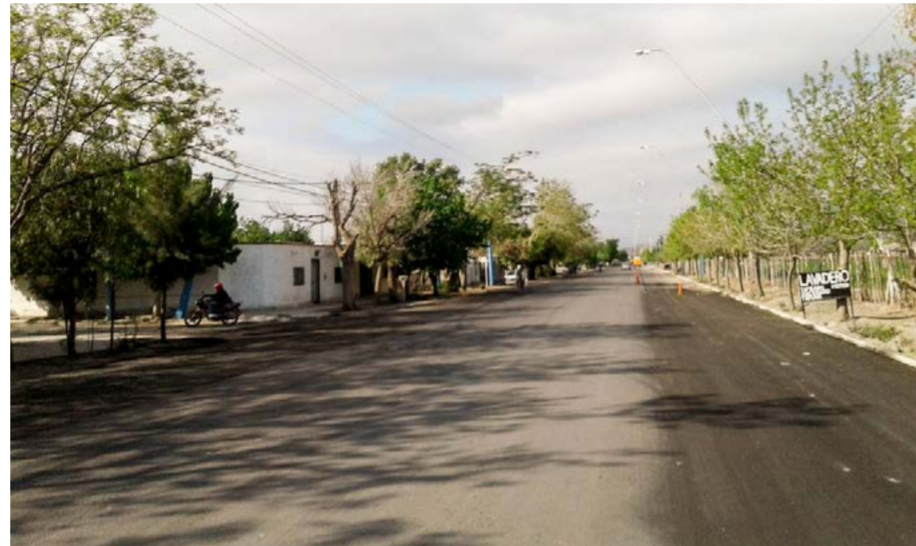
Cabe destacar la importancia de la comunidad para lograr la correcta atención de los visitantes, generando experiencias turísticas de calidad