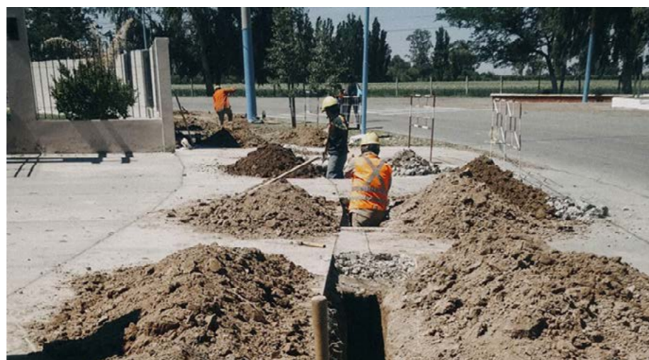
- 490m de Ø90mm - 450m de Ø63mm - 750m de Ø50mm). El inicio de las tareas fue el 17 de septiembre pasado y el plazo de ejecución es de 150 días corridos. Actualmente el progreso es del 50%.

Dicha red de media presión se inició con la elaboración del proyecto constructivo y, actualmente, se encuentra en etapa de ejecución. Las labores consisten en la construcción de aproximadamente 2.890 metros de red de media presión en caños de polietileno en sus distintos diámetros (1200m de Ø125mm