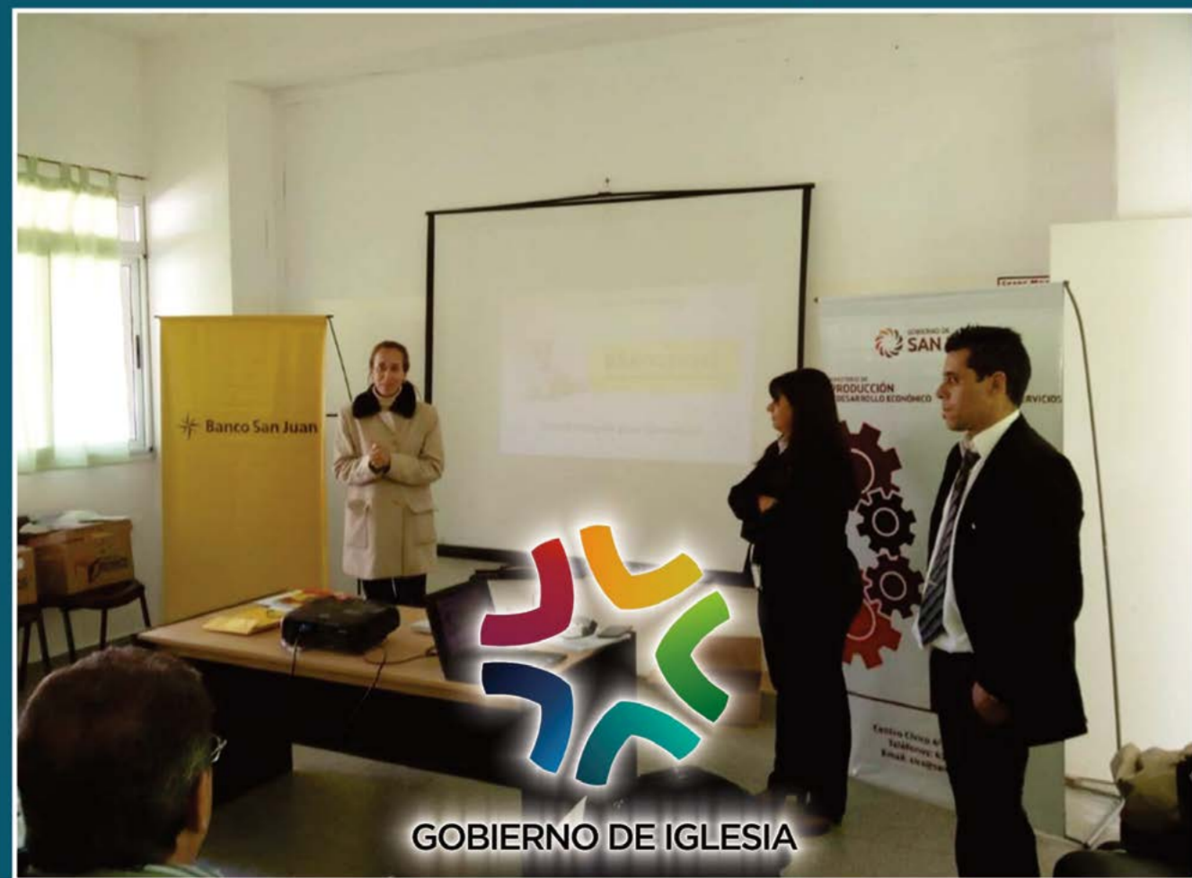
GOBIERNO DE IGLESIA

En el CIC de Las Flores se desarrolló la capacitación para comerciantes de nuestro departamento interesados en el uso de Posnet como herramienta de venta. Hubo una gran convocatoria y un gran interés por este sistema de venta que agiliza, optimiza y facilita la venta.