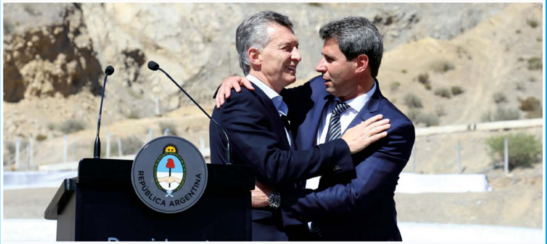
El Presidente puso en marcha las licitaciones para las obras del Túnel de Agua Negra