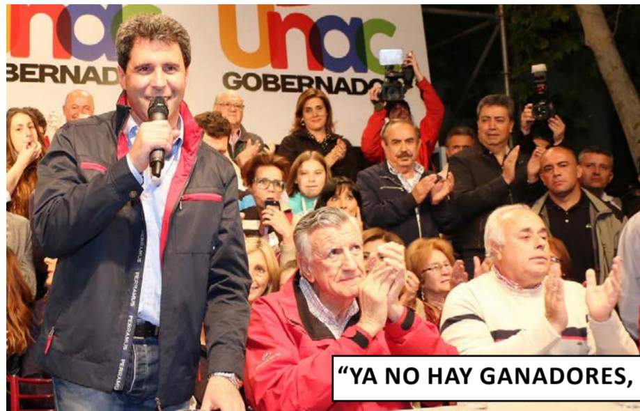
“YA NO HAY GANADORES, HAY AUTORIDADES ELECTAS”

El gobernador electo dijo que San Juan ha sido llamada a ser una de las mejores provincias del país. Fue electo con el 53% de los votos