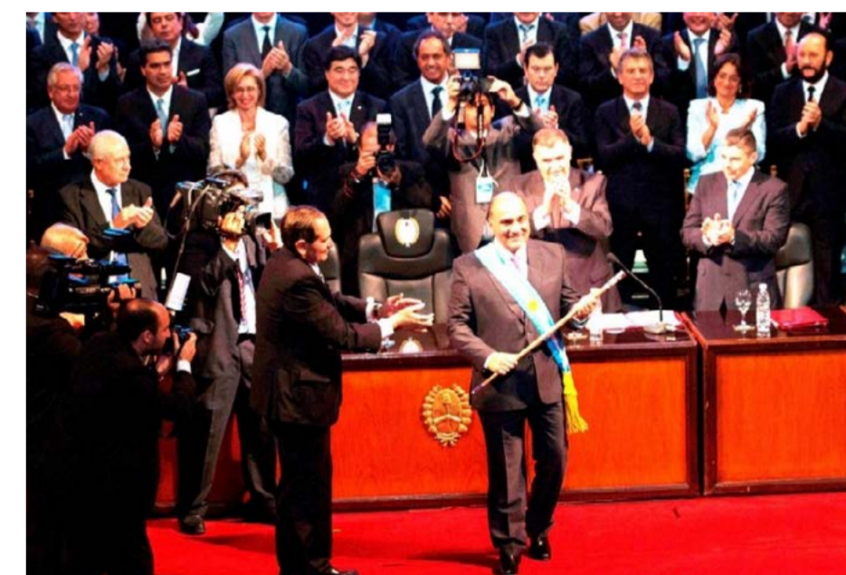
cándose a 35 puntos de diferencia con su rival, Daniel Scioli. En la capital cordobesa, el gobernador de la Provincia de Buenos Aires superó a UNA por un punto y ganó cuatro departamentos en el norte; todo el resto fue para Macri. En Neuquén, votó más del 70% del padrón compuesto por casi 500 mil perso-

dores electos durante 2015. Los dos distritos argentinos restantes, Corrientes y Santiago del Estero, elegirán sus autoridades provinciales en 2017 debido a sus intervenciones federales que modificaron el Cronograma Electoral. En las elecciones del 25 de octubre, en la provincia de Santiago del Estero arrasó el FpV y Macri quedó tercero. Hubo un claro triunfo de la alianza entre el radicalismo K y el PJ, de la mano del radical K Gerardo Zamora, presidente provisional del Senado y aliado incondicional del kirchnerismo. En Mendoza, Cobos volvió a ser el mendocino más votado logrando mayor apoyo que todos los postulantes a presidente y ocupará una banca en el Senado. Es que, el actual gobernador justicialista, Francisco "Paco" Pérez, fue el más "cortado" y rechazado por la ciudadanía y quedó fuera del Parlatur al ser superado por el radical Gabriel Fidel. Casi 40.000 mendocinos decidieron darle la espalda a todavía gobernador mendocino. En la provincia de Córdoba, Mauricio Macri logró el 53,7% en la elección ubi-