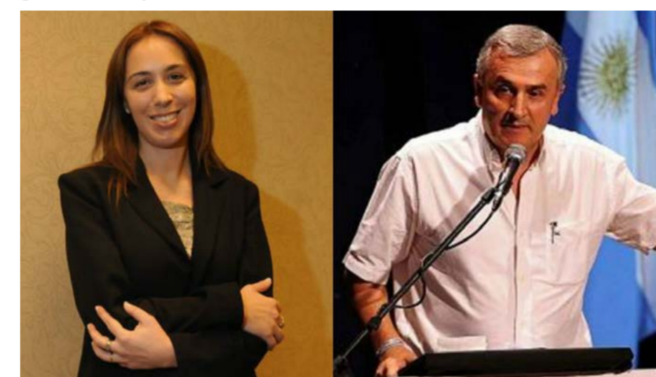
Morales y los suyos. Los militantes de Fellner decían que la decisión de aliarse con Sala había sido una especie de "salvavidas de plomo" para las aspiraciones del caudillo justicialista de seguir gobernando.

Diputados y en el Senado. En Jujuy, la oposición salió victoriosa frente a un bastión del peronismo. Gerardo Morales (58,34%) le sacó casi 30 puntos al candidato del FpV, Eduardo Fellner, y su triunfo marca el fin de 32 años de hegemonía del justicialismo en la provincia. El presidente del Partido Justicialista nacional, perdió la Gobernación y, por primera vez desde 1983, un radical conducirá la provincia. El gobernador electo se unió con el Frente Renovador, el Pro, los progresistas y partidos provinciales. Para estos comicios, el Frente para la Victoria se vio obligado a crear una alianza con la líder piquetera Milagro Sala. Aunque Fellner y Sala nunca pudieron disimular sus diferencias, debieron unirse para frenar el aluvión de