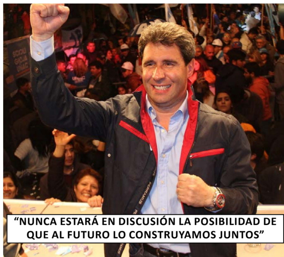
“NUNCA ESTARÁ EN DISCUSIÓN LA POSIBILIDAD DE QUE AL FUTURO LO CONSTRUYAMOS JUNTOS”