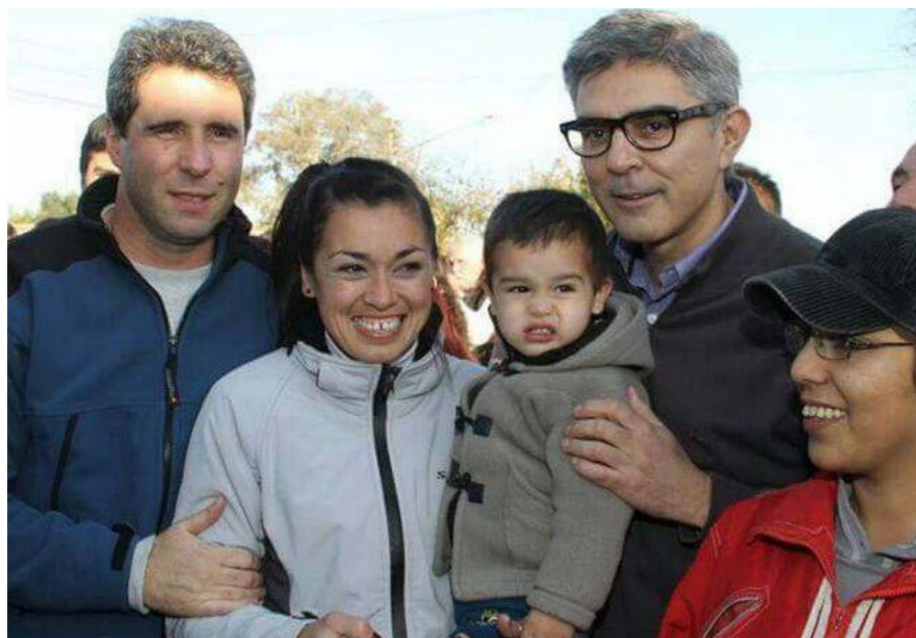
"QUEREMOS SUPERAR LAS OBLIGACIONES DE ALUMBRADO, BARRIDO Y LIMPIEZA"