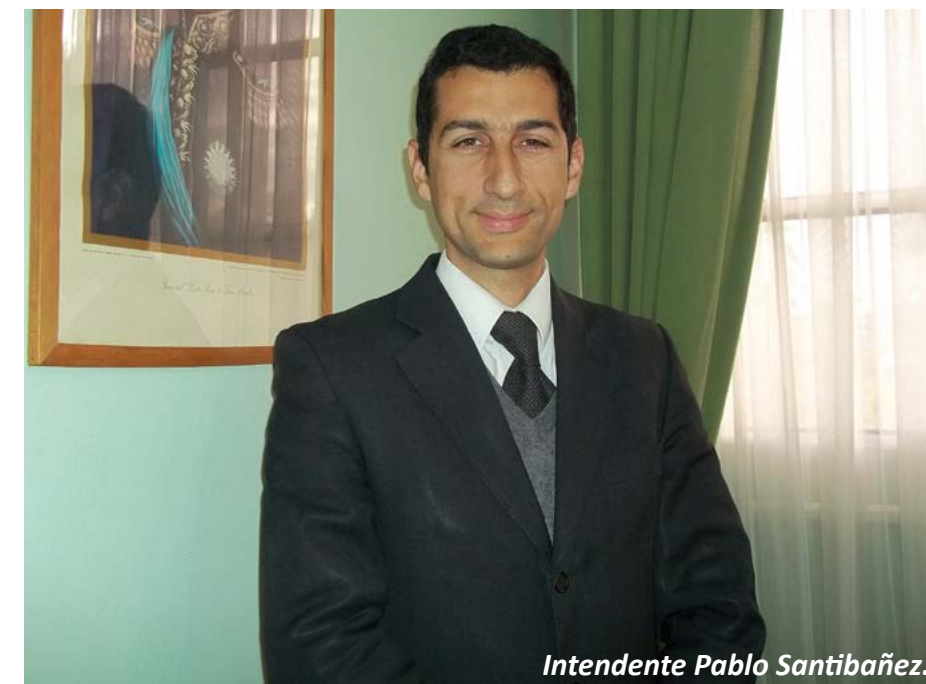
Intendente Pablo Santibañez.

"También hemos adquirido una máquina para pintar y señalizar vialmente las calles, que servirá para demarcar y dar más seguridad a los vecinos. A ello se le suma una máquina de bacheo para que las arterias queden en condiciones transitables", señaló el jefe comunal. "Ahora estamos hablando de que tenemos un camión compactador de residuos cada 5.500 habitantes cuando la media a nivel internacional es un camión cada 10 mil, la verdad que estamos avanzando mucho y tenemos mucho más por hacer", manifestó Santibañez. Por otro lado, el Intendente de San Mar-