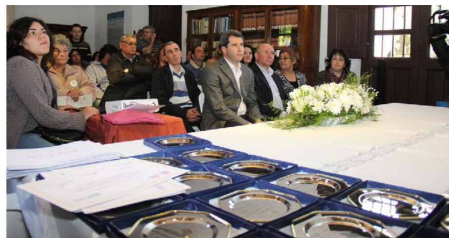
El premio "La Huerta de Doña Paula" fue declarado de interés Cultural, Social y Productivo por la Cámara de Diputados de San Juan.