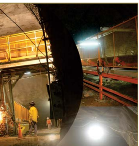
Mina Subterránea Gualcamayo, un sueño cumplido

En cuanto al volumen de embalse de las represas, Gioja expuso que los cuatro diques superan los 2000 hectómetros cúbicos, que cubrirían cómodamente los 1200 que necesita anualmente la población de San Juan, teniendo los diques llenos la provincia po-