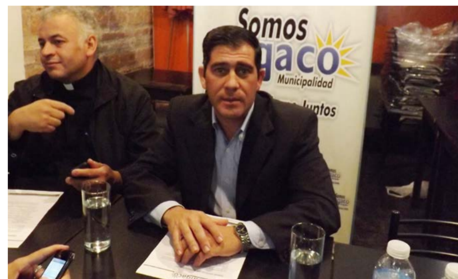
El futuro pueda comprar más aparatos en función de la demanda y la utilización de los mismos por la comunidad angacera.

Quienes los necesiten podrán acceder a través de las asociaciones civiles o de manera particular, presentándose en el edificio municipal en la oficina de Desarrollo Humano donde solicitarán la asistencia y se les hará firmar el comodato del aparato para hacer uso del mismo por el tiempo que se necesario. El intendente recaló que hace dos años que el contacto con la CONADIS es fluido y a través del organismo nacional se logró comprar una movilidad para el traslado de las personas con capacidades especiales. Con ella se puede asistir a las diferentes actividades dentro y fuera del departamento. El mandatario no descartó que en el