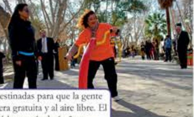
Las Pistas Saludables están destinadas para que la gente realice actividad física de manera gratuita y al aire libre. El programa se implementó hace más de 6 años.