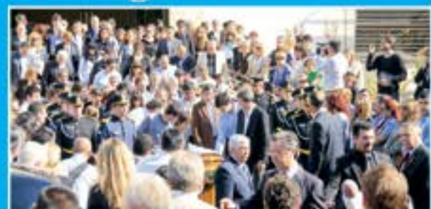
El sepelio parte de la Legislatura Provincial hacia el Cementerio de la Capital