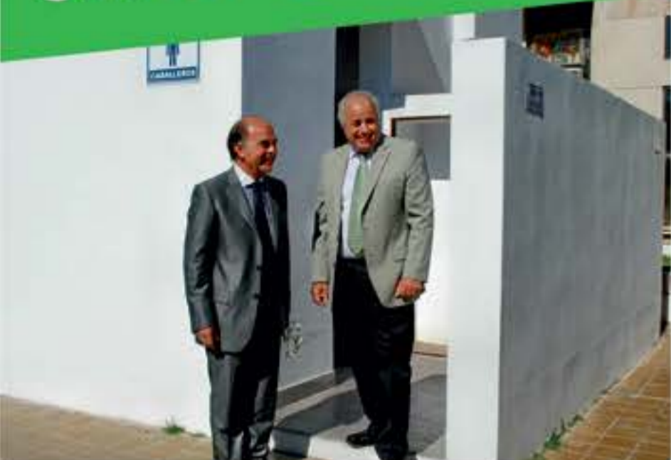
Una serie de obras de remodelación se llevaron a cabo en el Cementerio de la Capital, entre las que se incluyeron los sanitarios, quedando atrás los problemas que se suscitaban por falta de mantenimiento y precaria infraestructura.