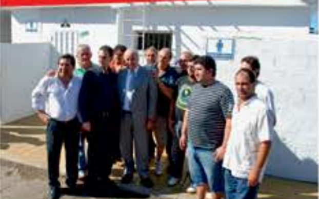
En el Mercado de Abasto también se realizaron obras de remodelación de sanitarios, en los cuales se cambiaron todas las remodelaciones sanitarias y eléctricas.