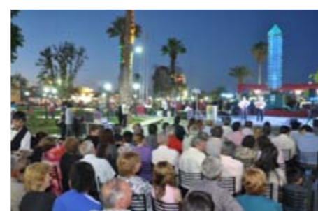
UN GRAN MARCO DE PUBLICO EN LA PLAZA CENTENARIO