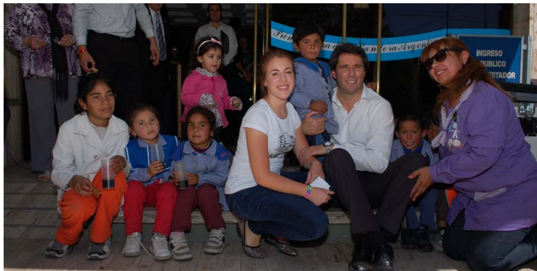
Laura Esquivel junto al vicegobernador Sergio Uñac en las puertas de la Legislatura, rodeada de niños.

Laura Esquivel, la actriz protagonista de la tira televisiva "Patito Feo" estuvo en San Juan y participó del V Congreso Mundial de Infancia y Adolescencia en el marco de las actividades proyectadas por la Legislatura en apoyo al V Congreso Mundial de Infancia y Adolescencia.