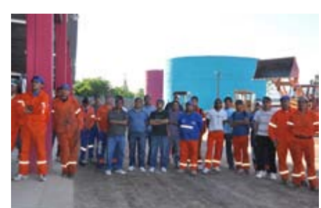
PERSONAL MUNICIPAL DE LA SECRETARIA DE INFRAESTRUCTURA