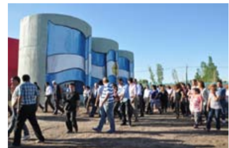
RECORRIDA POR EL PREDIO