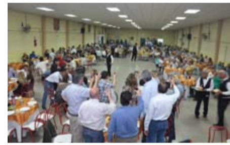
BRINDIS EN HONOR A LOS EMPLEADOS MUNICIPALES.

Para finalizar, la Orquesta Sinfónica Juvenil de San Vicente de Tagua, del país vecino de Chile, deleitó a los presentes con una variedad de ritmos musicales.