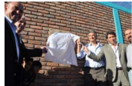
DESCUBRIMIENTO DE PLACA

Los sistemas de desechos de residuos sólidos tendrán previstas cámaras interceptoras de grasas y aceites en los sectores de talleres y movilidades como así también un sector de almacenamiento de residuos peligrosos para su eliminación periódica.