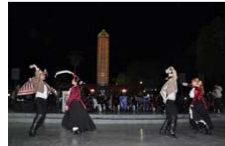
BALLET "BAFO AMÉRICA".