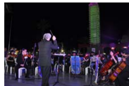
ORQUESTA SINFONICA JUVENIL DE SAN VICENTE DE TAGUA TAGUA - CHILE.