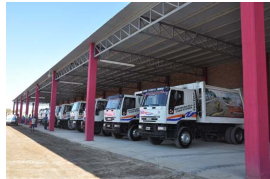
GALPON PARA MAQUINAS PESADAS Y CAMIONES

EL VICEGOBERNADOR SERGIO UCÑAC Y EL INTENDENTE DE RAWSON, JUAN CARLOS GIOJA, JUNTO A AUTORIDADES PROVINCIALES Y DEPARTAMENTALES DEJARON INAUGURADA LA PRIMER ETAPA DEL OBRADOR MUNICIPAL "LOS CILINDROS", EN EL PREDIO DONDE HABITABAN FAMILIAS DE UN ASENTAMIENTO PRECARIO, VILLA LOS CILINDROS, QUE FUERA REUBICADO EN EL MARCO DEL PROGRAMA DE ERRADICACIÓN DE VILLAS DEL GOBIERNO DE SAN JUAN.