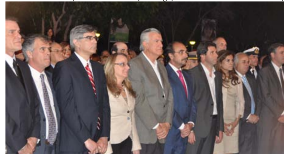
Funcionarios provinciales y nacionales en la apertura del V Congreso Mundial por los Derechos de la Infancia y Adolescencia.

LA DESIGNACIÓN DE ARGENTINA COMO SEDE PARA EL AÑO 2012, DEL “V CONGRESO MUNDIAL POR LOS DERECHOS DE LA INFANCIA Y LA ADOLESCENCIA”, SURTIÓ CON EL CONSENSO GENERAL DE LOS PAÍSES PARTICIPANTES DE TODOS LOS CONTINENTES QUE TUVIERON EN CONSIDERACIÓN LOS LOGROS DE NUESTRO PAÍS EN MATERIA DE POLÍTICAS PÚBLICAS DE INFANCIA Y ADOLESCENCIA EN LOS ÚLTIMOS CINCO AÑOS, Y EL ÉXITO DEL “CONGRESO SUDAMERICANO”, DESARROLLADO EN EL MES DE AGOSTO DE 2010 EN MORÓN, SITUACIONES QUE EMPUJARON LA BALANZA A FAVOR DE LA DESIGNACIÓN DE ARGENTINA, POR SOBRE LOS OTROS CANDIDATOS POSTULADOS.