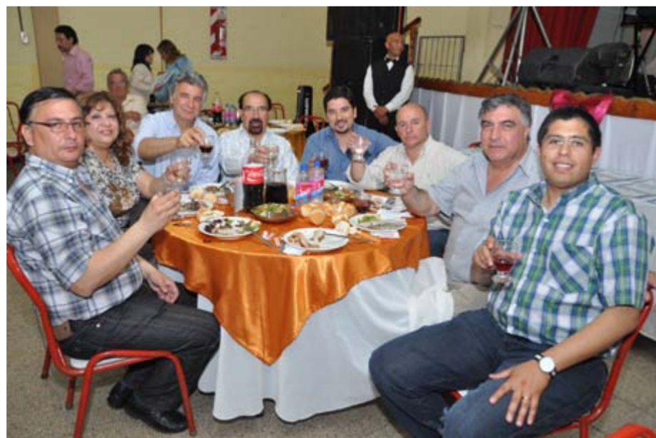
INTENDENTE Y DIRECTIVOS DEL MUNICIPIO Y HONORABLE CONCEJO.