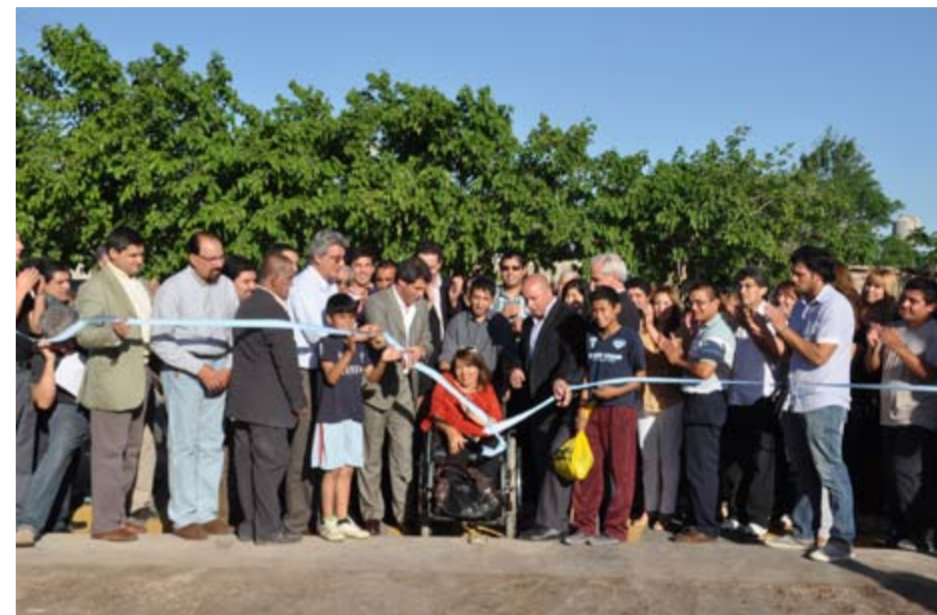
CORTE DE CINTA

La Municipalidad de la Ciudad de Rawson, decidió recuperar el espacio, e iniciar un proyecto de construcción del obrador municipal, que también carecía de la infraestructura necesaria para su funcionamiento. La Primera etapa del mismo quedó ya inaugurada y tiene las siguientes características: