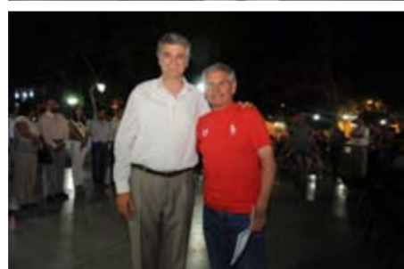
EMPLEADOS JUBILADOS AGASAJADOS