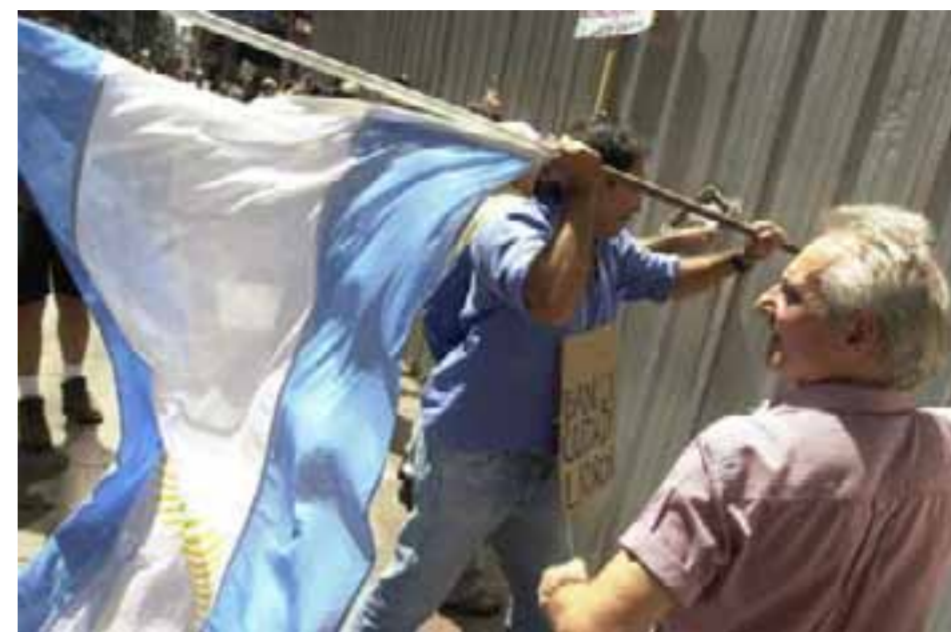
El pago del Boden 2012 pone fin a la época trágica del corralito implementada por Fernando de la Rúa, Domingo Cavallo y, posteriormente, Eduardo Duhalde

Vaticinó que "de acá en más se genera una situación bastante favorable en materia de deuda para el Gobierno, porque los vencimientos con acreedores privados son de 4.600 millones de dólares durante 2013 y uno de 2.500 millones de dólares durante 2014", que el país pagará mediante cupón PIB, lo que le dará "un