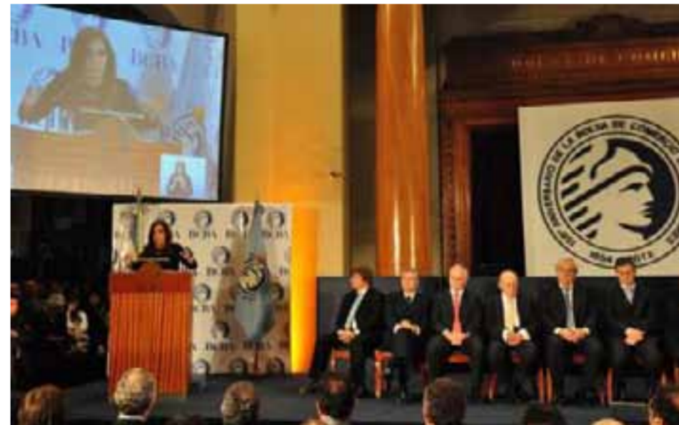
La presidenta Cristina Fernández durante el acto donde se saldaron los Boden 2012

El 3 de febrero de 2002, Duhalde, a través del decreto de necesidad y urgencia 214, determinó que "todos los depósitos en dólares estadounidenses u otras monedas extranjeras existentes en el sistema financiero" fueren convertidos a pesos a razón de 1,40 pesos por cada dólar estadounidense, o su equivalente en otra moneda extranjera.