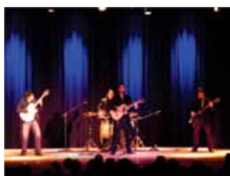
El Cine Teatro de Albardón en sus dos años de puesta en marcha ya se transformó en un espacio cultural de trascendencia.