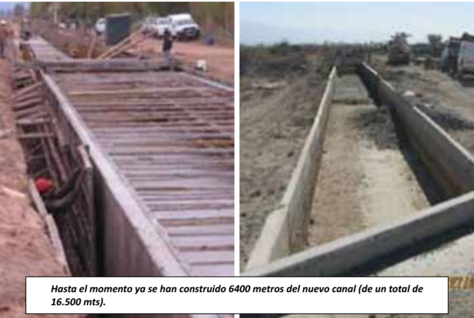
Hasta el momento ya se han construido 6400 metros del nuevo canal (de un total de 16.500 mts).