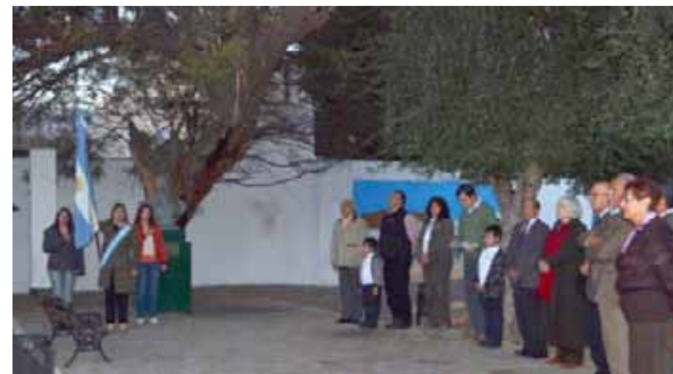
El acto institucional para conmemorar los 191 años de la Independencia de Perú, organizado por la Asociación de Familias Peruanas residentes en San Juan, se llevó a cabo en la Celda Histórica de San Martín en el Convento de Santo Domingo.

Se realizó un acto institucional en la Celda Histórica de San Martín en el Convento de Santo Domingo.