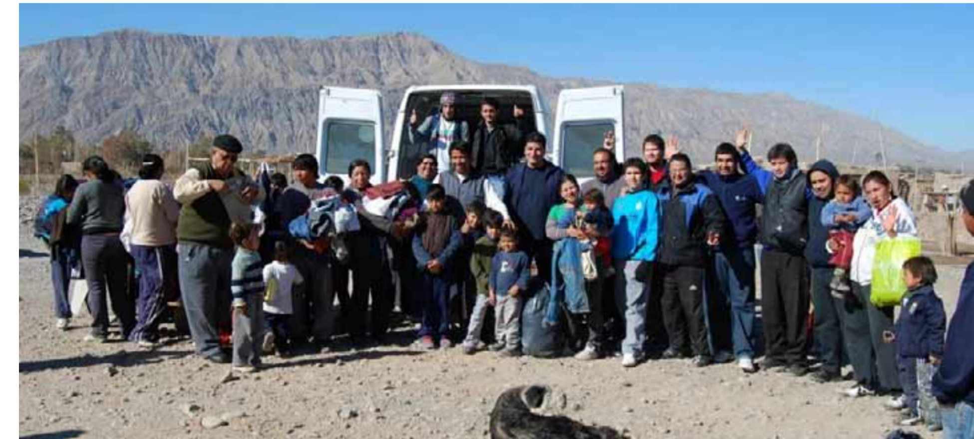
El grupo está definiendo el próximo destino y cada vez se suman más periodistas.

El grupo de profesionales de medios de comunicación llegó con ropa de abrigo, calzado, juguetes y leche en polvo para las más de 30 familias que viven en la humilde zona al pie del cerro.