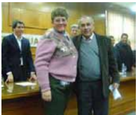
Los vecinos beneficiados aprovecharon la oportunidad para agradecer al Intendente las gestiones hechas por Chimbas.