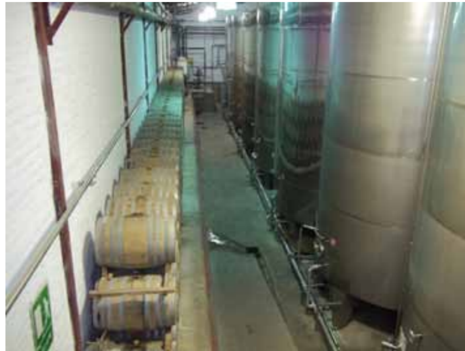
Parte de la moderna planta donde la cooperativa CAPEL produce sus piscos mundialmente famosos.