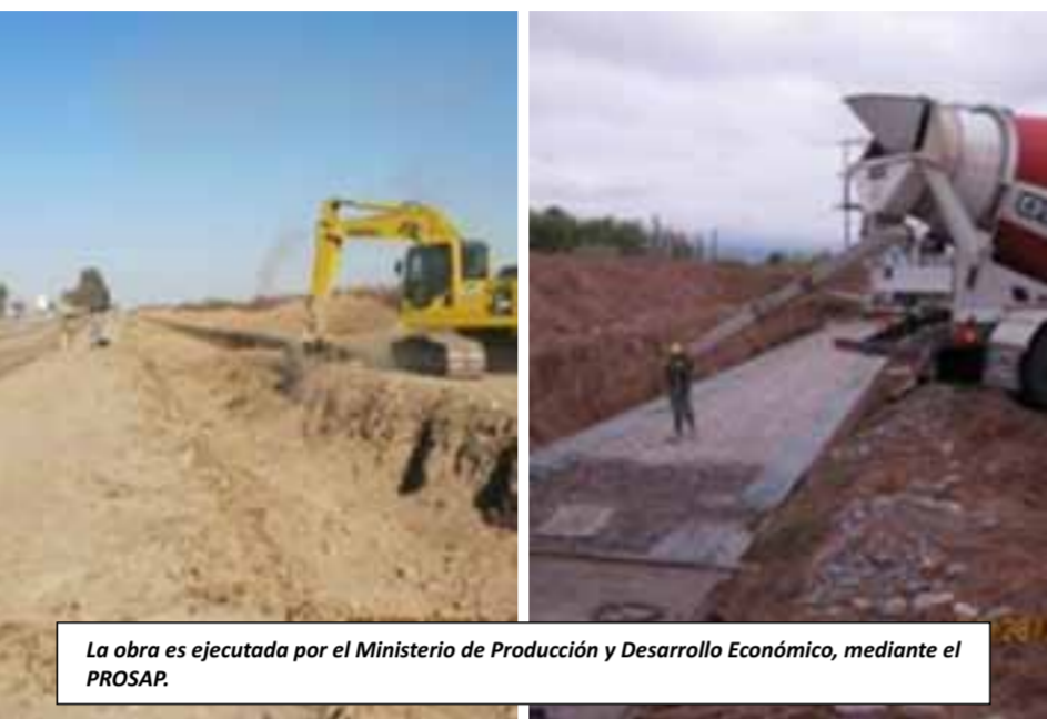
La obra es ejecutada por el Ministerio de Producción y Desarrollo Económico, mediante el PROSAP.

MEJORA DE PROVISIÓN Y CALIDAD DEL AGUA El objetivo de la obra que coordina el Prosap es mejorar la provisión y la calidad del agua para unos 600 productores de la zona, donde prevalecen los viñedos, los olivares, las plantaciones de melón y de semillas. Hoy en Sarmiento, con el agua disponible, se cultivan 9 mil hectáreas con derecho a riego, y con el nuevo canal terminado se podrán sumar otras 4 mil hectáreas con derecho a riego.