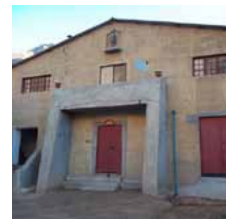
La pisquera Los Nichos, una de las últimas bodegas artesanales donde se produce aguardiente, pisco y vinos dulces en Chile.