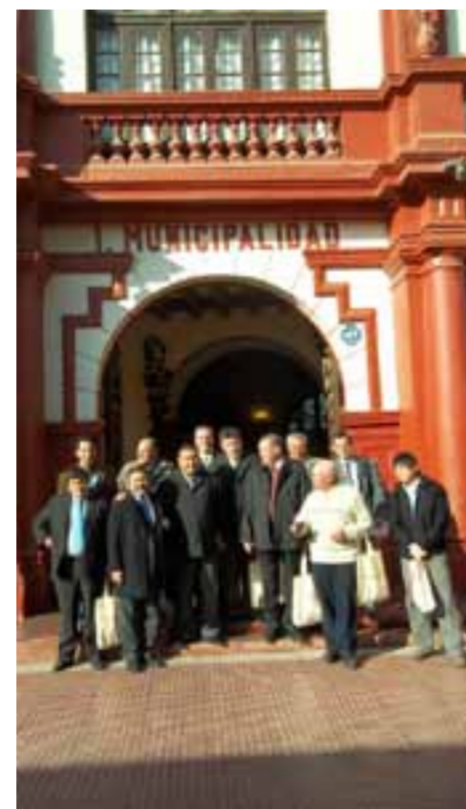
La comitiva caucetera en pleno frente al edificio municipal de la Alcaldía de La Serena.

Durante el encuentro, ambos mandatarios comunales intercambiaron sus pareceres sobre las posibilidades