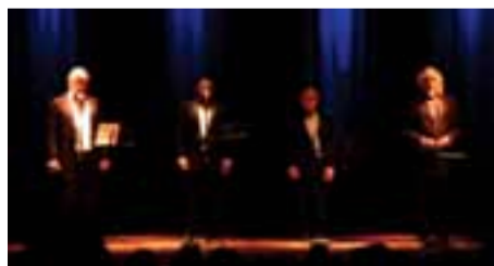
En este complejo cultural se desarrollan obras de teatro, funciones de cine, muestras, exposiciones artísticas, artesanales o pictóricas. Además el espacio es propicio para la realización de congresos, convenciones o cursos de capacitación.

Después del último bis y más aplausos, llegó la hora del brindis. Para ello se dispuso una carpa blanca en la que se ofreció un ágape. Los presentes disfrutaron de una degustación de vinos de bodegas albardoneras y otras delicias del departamento. Fue el final de una noche de lujo.