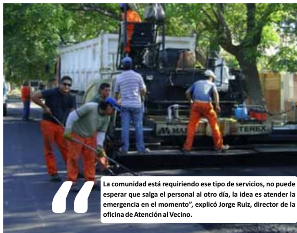
MANOS A LA OBRA: Algunos vecinos están pidiendo delegaciones para formar proyectos barriales.

Otra iniciativa de la oficina es cubrir los