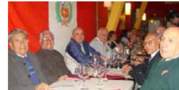
Luego del acto institucional, los integrantes de la Asociación de Familias Peruanas compartieron una cena de camaradería.