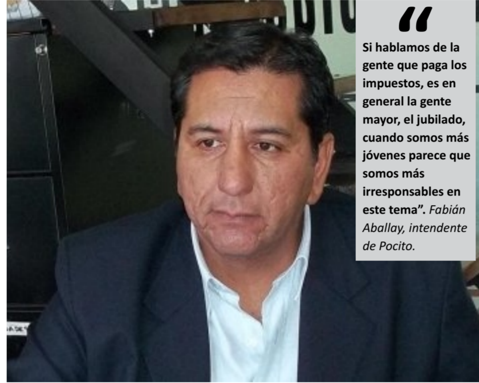
El Intendente destacó el crecimiento poblacional del departamento.

El Municipio se reunió con la Gerencia de la sucursal del banco San Juan en Pocito y ya se están trabajando en un tercer cajero en el corazón de Villa Aberastain, en las inmediaciones de calle 11 y Avenida Aberastain. Esta medida se