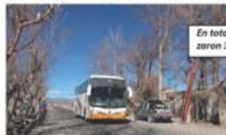
En total se reemplazaron 32 luminarias.

Fue a través de un convenio firmado entre el Municipio de Iglesia y Barrick. Se reemplazaron 32 cruces de alumbrado público por postes de alumbrado de 14 metros.