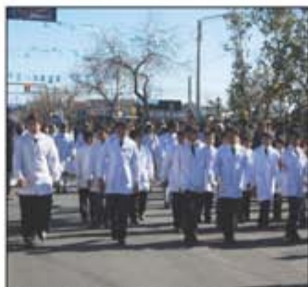
Alumnas de la Escuela Presidente Juan Domingo Perón.