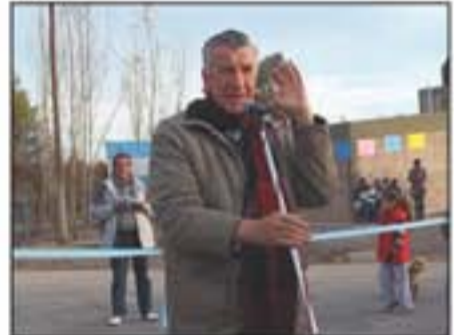
El primer mandatario provincial dijo que por "urbano" debe entenderse "todo aquel lugar donde hay gente que merece una mejor calidad de vida".