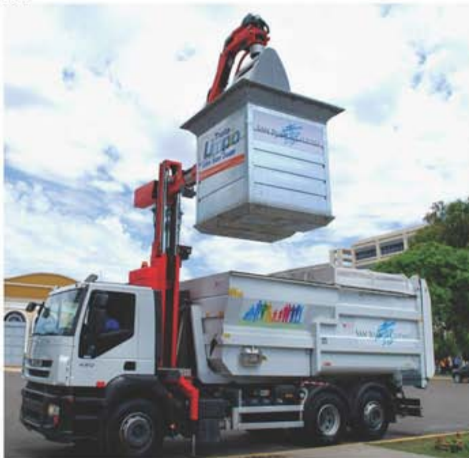
El sistema de Recolección automatizado de Residuos funciona en Capital desde 2010.

En un principio comenzó con 35 contenedores y un camión recolector en el microcentro. Posteriormente y tras el acuerdo con los vecinos se firmaron convenios para llevar el sistema a asentamientos poblacionales de gran envergadura