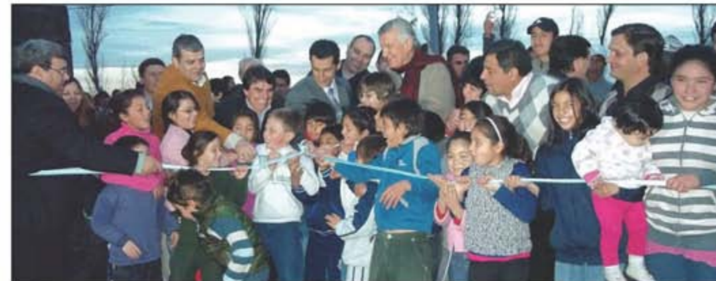
Los niños del barrio San Isidro I y San Isidro II se peleaban por tirar de las cintas e inaugurar junto con las autoridades las nuevas obras viales en la comuna.

En estas arterias se realizó la construcción del terraplén, sub base y base, imprimación bituminosa, riego de liga y construcción de capa de rodamiento en concreto asfáltico en caliente de 5 centímetros de espesor y 6 metros de ancho. La obra comprende una longitud de 3.200 metros sobre calle Colón y 700 metros en calles internas del barrio San Isidro Labrador I y II. Los trabajos también contemplaron la construcción de pasantes de agua de regadío y pluviales, la ampliación y edificación de cabeceras en pasantes de cunetas y drenes y la señalización horizontal y vertical en todo el recorrido de las calles pavimentadas. El monto total de la obra fue de 2.208.927 pesos.