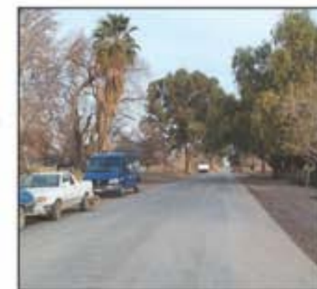
Las nuevas calles pavimentadas de villas Hilario Elorza y Lugano.

Las obras de villas Hilario Elorza y Lugano y las del Barrio Rocío Luján fueron financiadas por el Plan 800 cuadras que suscribió el gobierno provincial con el conjunto de los departamentos sanjuaninos. A San Martín se destinaron más de dos millones de pesos que sirvieron para pavimentar, además, la totalidad de las calles internas del barrio Dos Acequias, entre otras arterias.