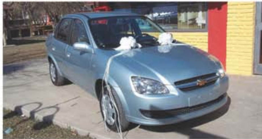
Uno de los dos 0Km sorteados por Luz y Fuerza.