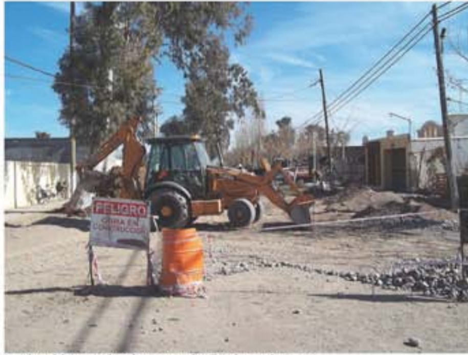
Las obras del sistema cloacal avanzan en la villa cabecera de Angaco.

A la vez, el Municipio trabaja en la mega obra del sistema cloacal en la villa cabecera y planea finalizarla antes de fin de año. “Es una obra que tenía programada solamente la instalación del sistema colector principal y hoy estamos trabajando en la segunda y tercera etapa que incluye la conexión domiciliaria”, agregó Castro.