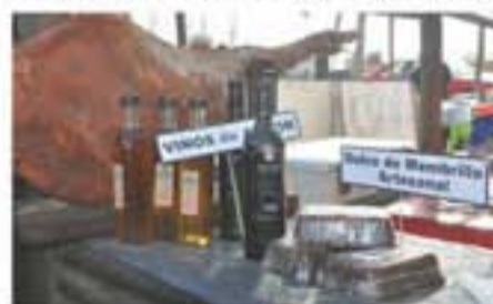
También se ofrecieron productos regionales, hechos en Rawson.

12 MIL PERSONAS PARTICIPARON DEL EVENTO DURANTE SUS DOS JORNADAS