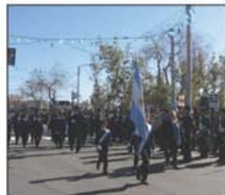
Alumnos de la Escuela San Juan EUDES.