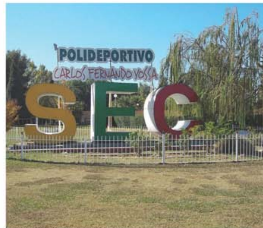
Instalaciones del Camping Empleados de Comercio.

—En el ámbito gremial vamos a encarar una tarea de control del trabajo en negro. Nosotros calculamos que un 30 por ciento de los trabajadores del comercio de San Juan no se encuentran debidamente registrados. Para llevar a cabo estos controles, estamos haciendo acuerdos con la Subsecretaría de Trabajo de la Provincia y el Ministerio de Trabajo de la Nación. Vamos a