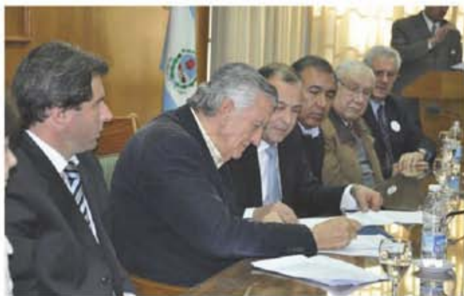
El gobernador José Luis Gioja firmó el contrato de construcción del Teatro del Bicentenario en la sala Rogelio Cerdera de Casa de Gobierno.

La empresa constructora está conformada por UTE formada por Panedile Argentina S.A y las empresas de San Juan Perfil S.R.L y Cesar Borrego S.R.L. La entidad que más abogó por la cons-