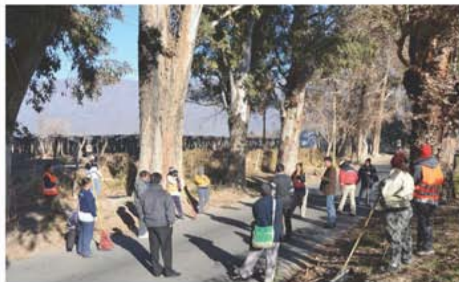
Los vecinos colaboran con la limpieza de calle Sarmiento gracias al plan Argentina Trabaja.

La calle Las Moras tendrá 1.500 metros de nuevas luminarias y en calle Sarmiento, los trabajadores de los planes Argentina Trabaja, realizan una profunda limpieza. Además se llevan a cabo tareas de reparación en el cementerio municipal.