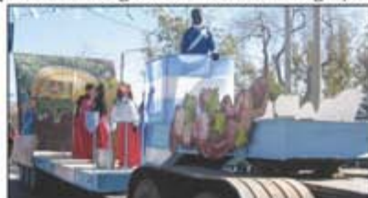
Uno de los carruajes que mostró la identidad de Rawson, reflejando historia y cultura.