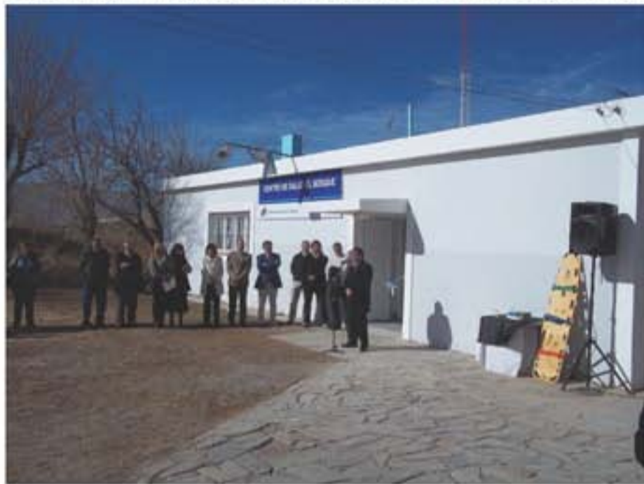
El Ministro Balverdi junto al Intendente Castro en la inauguración del Centro de Salud El Bosque en Angaco.

Según el Ministro de Salud Oscar Balverdi, se esperaba alcanzar esa cifra recién en 2015 lo cual pone de manifiesto el buen trabajo en conjunto entre el Ministerio y los Municipios. El anuncio se hizo durante la inauguración de un Centro de Salud en Angaco.