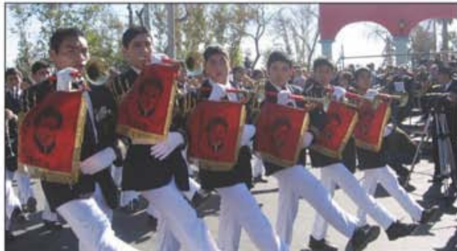
El paso de la Orquesta Instrumental de La Serena, Chile.

Rawson se destacó con el impecable desfile cívico militar que organizó para conmemorar el Día de la Independencia. No fue un desfile más, fue todo un despliegue artístico y cultural que sorprendió a las casi 70 mil personas presentes en el evento, que se desarrolló sobre Boulevard Sarmiento, desde Calle Lemos hasta Mendoza.