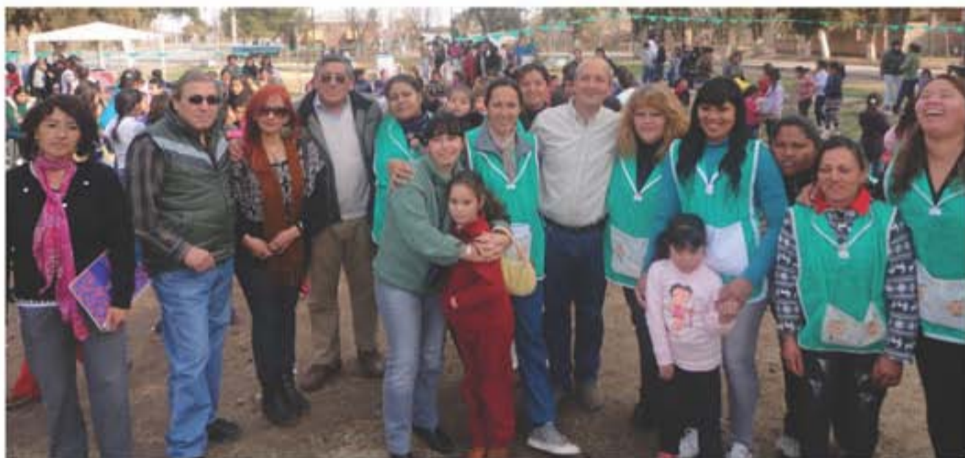
El intendente de 25 de Mayo, Rolando Quiroga, junto a concejales y organizadores de los eventos infantiles.

En distintos distritos del departamento 25 de Mayo se llevaron a cabo diferentes actividades en estas vacaciones de invierno. Estuvieron presentes los principales agasajados: niños de todas las edades, junto a sus padres y autoridades municipales, encabezadas por el intendente Rolando Quiroga. Hubo títeres, obras de teatro, castillos, chocolate, música, magia y desfiles.