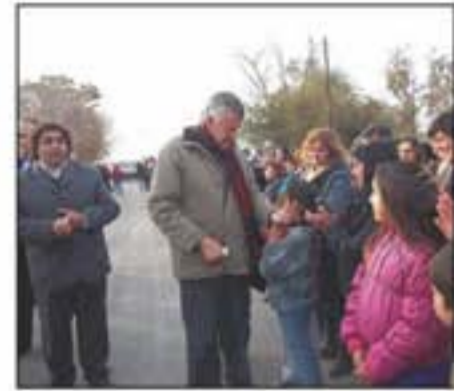
El gobernador Gioja saluda a los vecinos de Dos Acequias, en su visita a San Martín.

En una nueva visita del primer mandatario provincial, al departamento se habilitó obras de asfalto en las villas Hilario Elorza y Lugano, en el Barrio Rocío de Luján y en calle Colón, entre Sarmiento y Laprida, además de las calles internas del barrio San Isidro I y II.