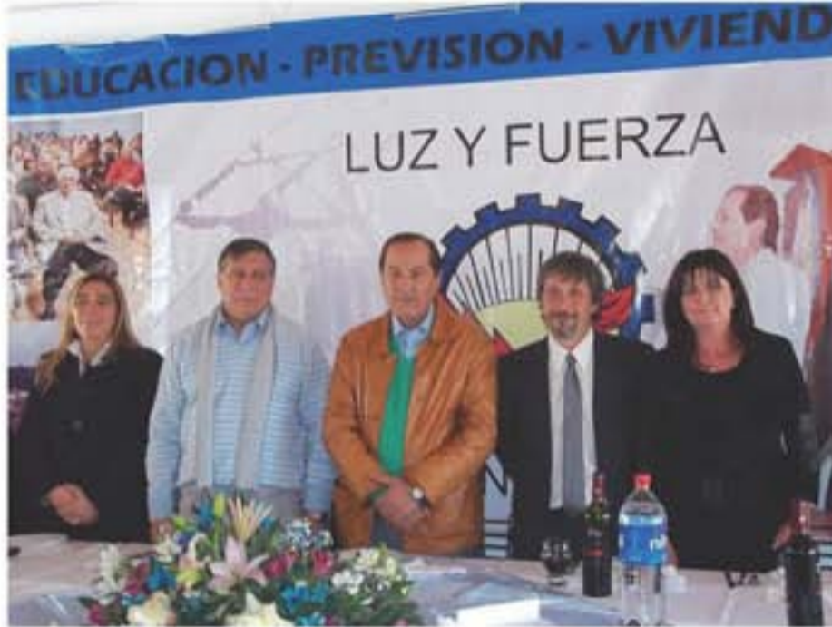
La mesa de autoridades y dirigentes en el almuerzo de Luz y Fuerza.

En las instalaciones del camping "El Paraíso" se realizó un almuerzo para los militantes de Luz y Fuerzas y sus familias. El evento contó con la actuación del Grupo Alquimia Cuyana, Como todos los años hubo sorteos, música y baile.