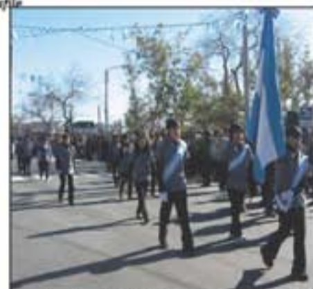
Abanderados del Colegio Santa Teresita del Niño Jesús.