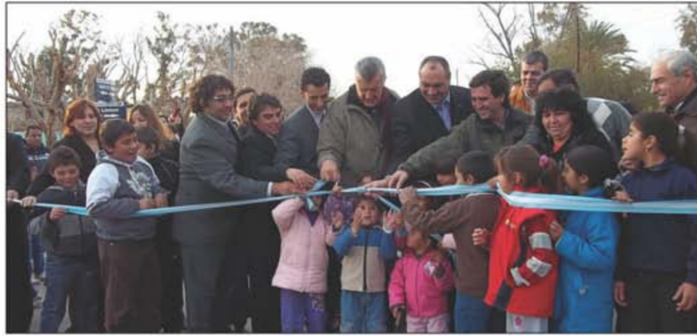
La primera de las inauguraciones se realizó en la villa Hilario Elorza y villa Lugano.