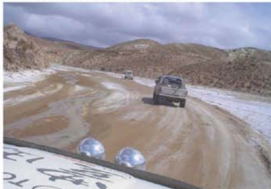
Parte de las obras de repavimentación abarcarán la Ruta Nacional 149, de Las Flores, Iglesia.

Será para la repavimentación y mejoramiento de la Ruta Nacional 149 (Las Flores – Iglesia) y la construcción de dos by pass que evitará que el tránsito pesado que va a las minas de Veladero y Lama – Pascua, ingrese a las localidades de Las Flores y Rodeo.