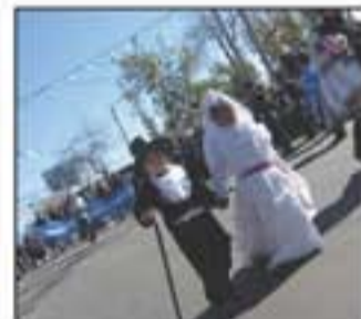
Dos pequeñitos representando a la Unión Vecinal de Villa Hipódromo.