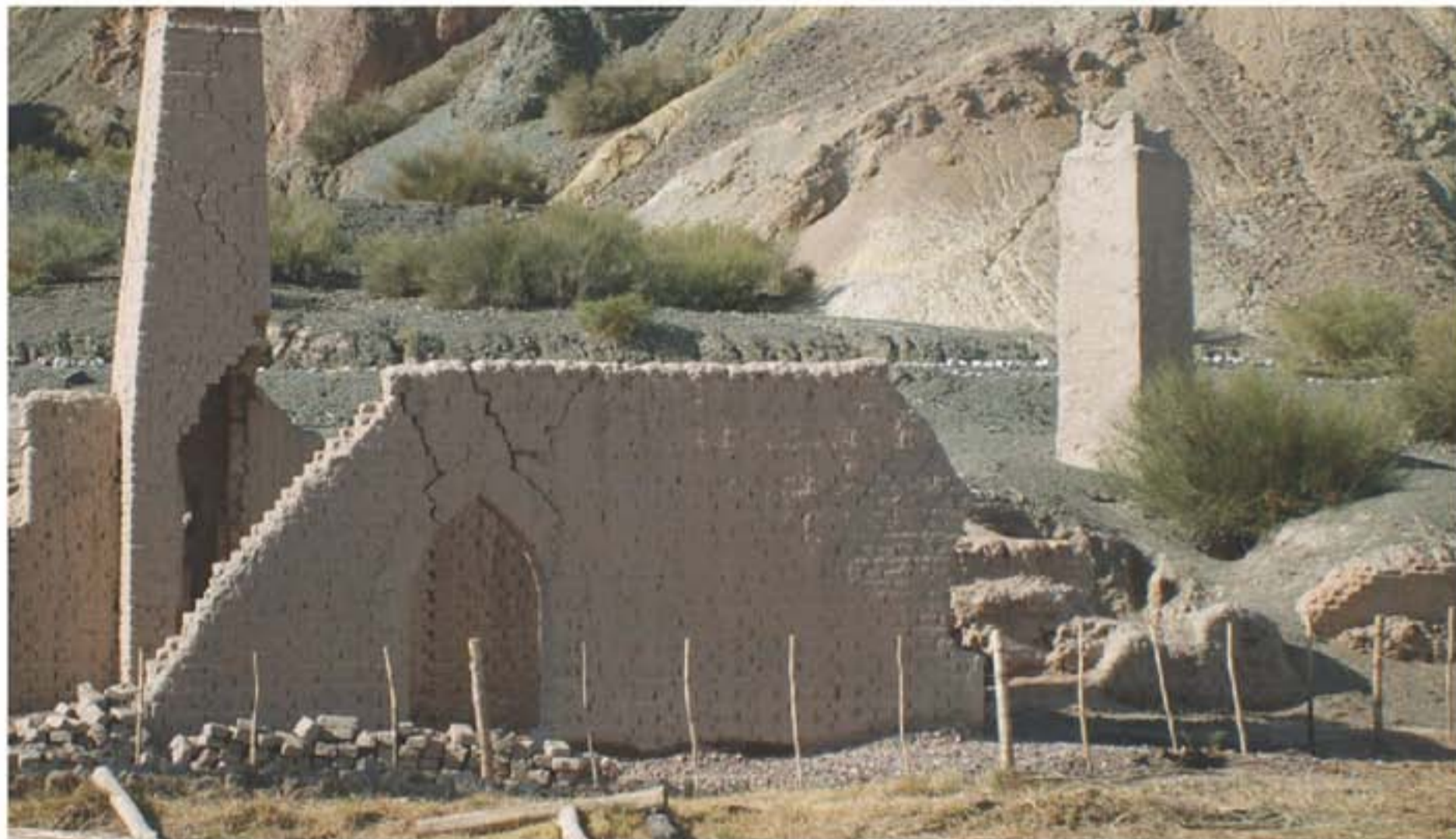
Las Ruinas están ubicadas a unas 140 km de la ciudad de San Juan aproximadamente.

Los inmuebles serán destinados a la conservación, revalorización histórica, cultural, patrimonial y como lugar de atracción educativa y turística.