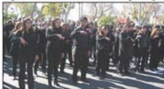
El grupo de intérpretes de lenguaje de señas, acompañando a los cantores de Rawson.

De esta forma Rawson se lució para el Día de la Independencia, con un desfile impecable, donde todas las manifestaciones culturales del departamento estuvieron presentes. Nada faltó, fue una verdadera fiesta patria, con todo el color popular.