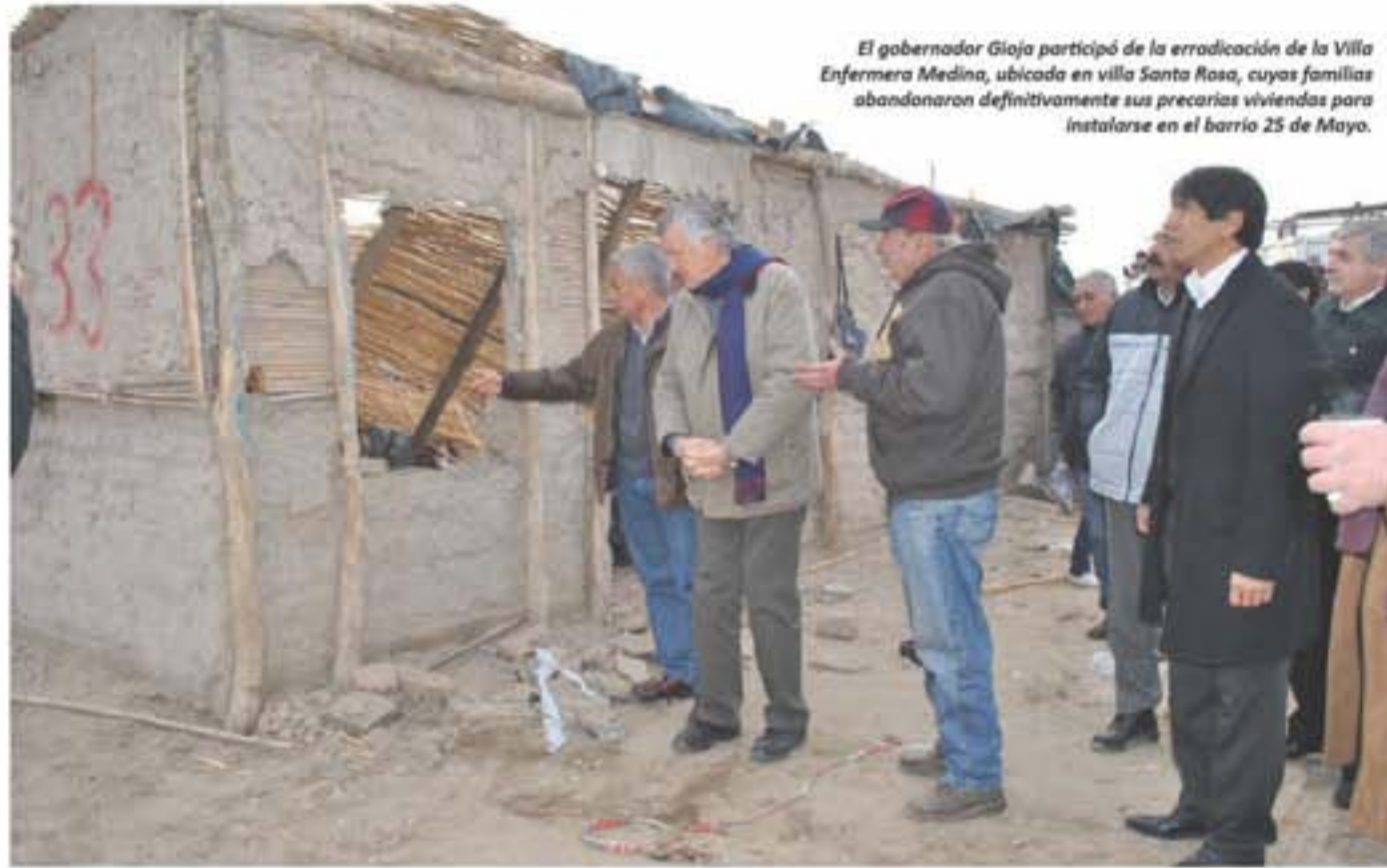
El gobernador Gioja participó de la erradicación de la Villa Enfermera Medina, ubicada en villa Santa Rosa, cuyas familias abandonaron definitivamente sus precarias viviendas para instalarse en el barrio 25 de Mayo.

Es a través de un programa de la Nación que contempla el acuerdo del Municipio con los gremios. Además, el Intendente Quiroga anunció el enripiado de todas las calles del departamento.