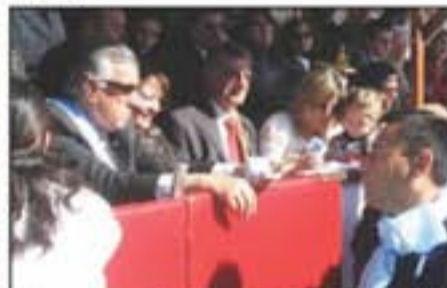
Chicos con capacidades especiales entregan obsequios al gobernador a las autoridades provinciales y municipales, presentes en el desfile.