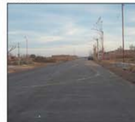
Las calles internas del barrio Rocío de Luján.