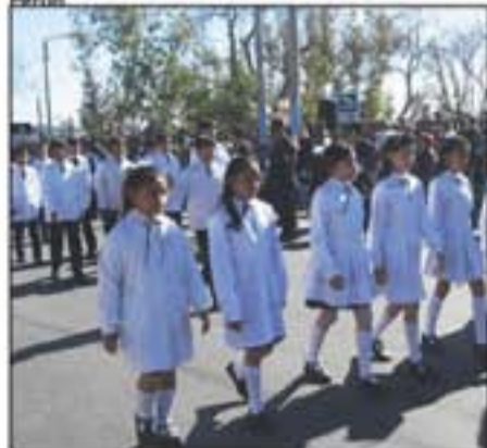
Alumnas de la Escuela Carlos María De Alvear.