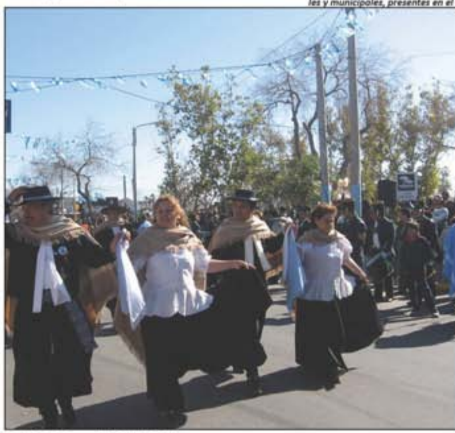
Centro de la Tercera Edad Colonia Rosales.