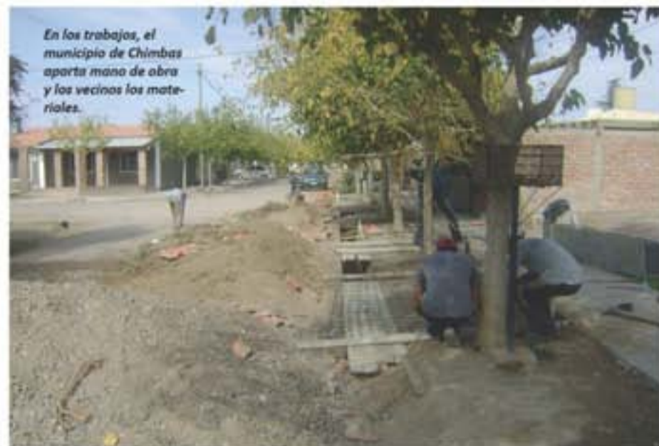
En los trabajos, el municipio de Chimbas aporta mano de obra y los vecinos los materiales.

La municipalidad de Chimbas y un grupo de vecinos trabajan en varias obras públicas. Los proyectos en conjunto incluyen una gruta, cerramiento de calles, excavación de pozos negros y construcción de cunetas y pasantes en diferentes barrios.