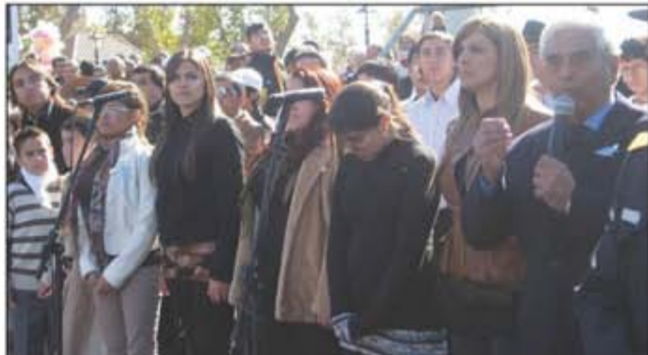
Los artistas de Rawson ofrecieron "Mi querido San Juan" para las presentes.

La cultura local quedó reflejada en cada momento del desfile. Participaron todas las instituciones del departamento, además de las escuelas y fuerzas de seguridad. Los artistas también tuvieron su espacio y se contó con la presencia de la Banda Instrumental de La Serena, Chile, entre las grandes sorpresas de la jornada patria