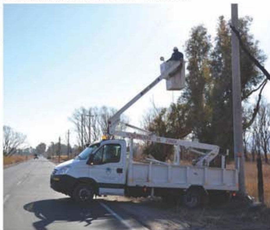
Serán 1500 metros de nueva iluminación en calle Las Moras.

Los directivos de la Escuela Mercedes Nievas de Castro solicitaron a la comuna, la realización de distintas obras durante el receso invernal. Cierre perimetral, pintura y limpieza en general, son algunos de los trabajos que se realizaron en este centro educativo. El recorrido del intendente junto a los concejales concluyó por distintos barrios del departamento donde se han realizado trabajos de limpieza. "En campaña prometimos obras de mejora y el contacto permanente con la comunidad, estos recorridos los realizamos con los funcionarios en forma periódica y nos encontramos con los vecinos que plantean distintas inquietudes", sentenció el Intendente.