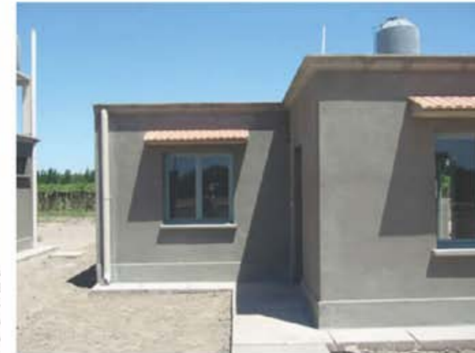
En lo que va de julio, el IPV lleva firmados contratos por 600 viviendas.