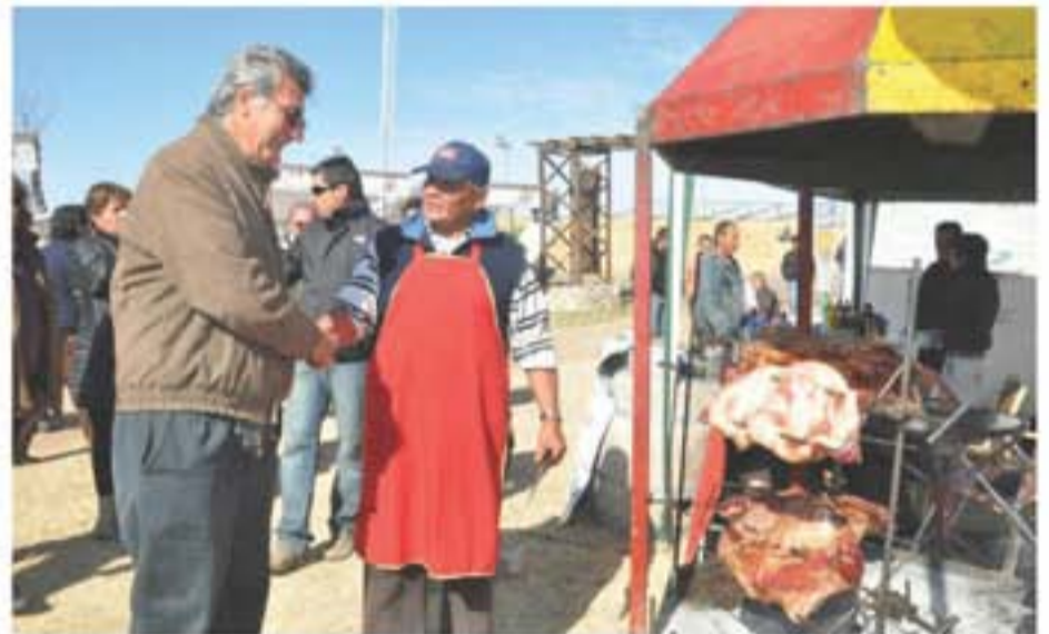
El intendente Juan Carlos Gioja saluda a uno de los expositores de la Gran Feria gastronómica.

El público pudo disfrutar del amplio patio de comidas con menús típicos y de distintas colectividades, espectáculo con reconocidos artistas, patio de juegos infantiles, exposición de artesanías, comidas típicas, caballos y carruajes de época para alquiler, cómodas instalaciones entre otras atracciones.