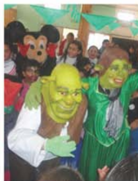
Todos los personajes de las películas que más les gusta a los chicos estuvieron presente en los agasajos.