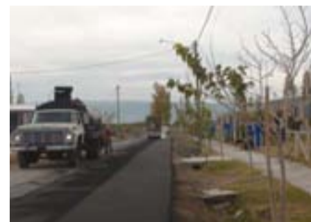
Los trabajos de pavimentación en las calles de San Juan.