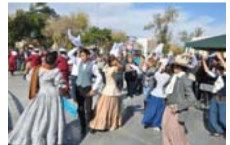
La danza, también presente en los festejos.