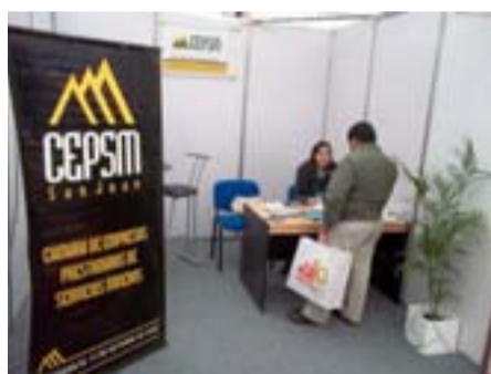
La Cámara de Empresarios Prestadores de Servicios Mineros, presente en la Feria Minera.