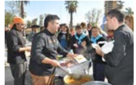
Comida típica para degustar en el Día de la Patria.