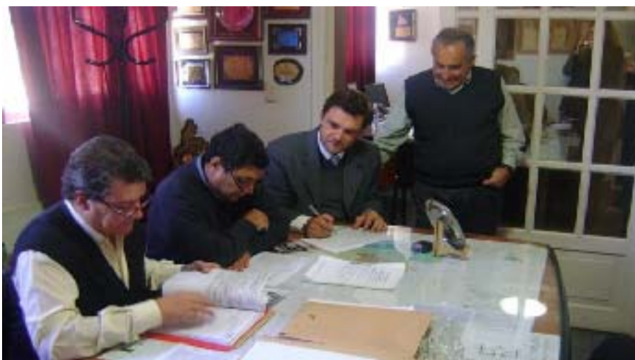
Momento en que se conocen las ofertas para el servicio de recolección de residuos domiciliarios.

pavimentos cambian la calidad de vida de cada uno de los vecinos, hoy en villa obrera tenemos el 60 por ciento de la superficie pavimentada de todas las calles y vamos a seguir trabajando y cumpliremos el cometido de entregarle a la gente lo que nos ha pedido”.