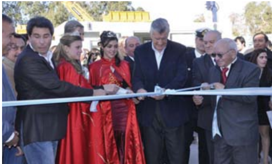
Corte de cinta para dejar oficialmente inaugurada la IV Exposición Internacional “San Juan Factor de desarrollo de la Minería Argentina”.

los pilares de desarrollo de esta provincia y al país le está dejando mucho dividendos y está generando desarrollo en zonas donde antes no había nada. Además esta industria está corrigiendo desequilibrios que existen en el desarrollo regional”, señaló el gobernador José Luis Gioja, al inaugurarse la muestra. Además dijo que la provincia de San Juan hizo mucho mérito para que la feria se vuelva a hacer acá. “Es una oportunidad grande para mostrar lo que los sanjuaninos somos capaces de hacer. Este país tiene mucho para dar con esta actividad productiva”, acotó.