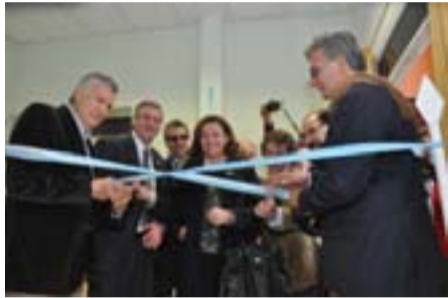
Corte de cinta para dejar inaugurado el nuevo CIC del Médano de Oro.