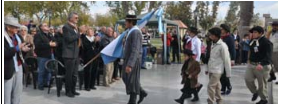
Rawson se vistió de celeste y blanca para festejar el cumpleaños de la Patria.