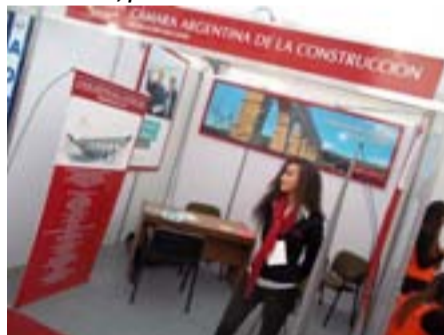
El rojo fue el color elegido para el stand de la Cámara Argentina de la Construcción.