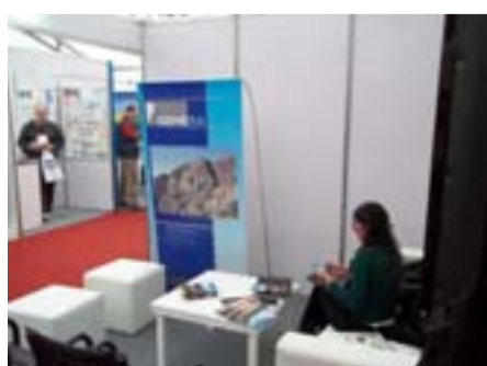
El stand de GEMERA (Grupo de Empresas Mineras Exploradores de la República Argentina).