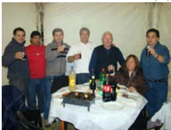
Avila recibe constantemente el apoyo de los afiliados del SEC.