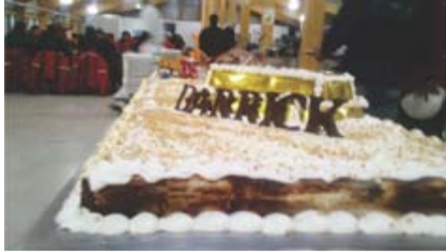
Festejos en comedor Los Amarillos – Lama