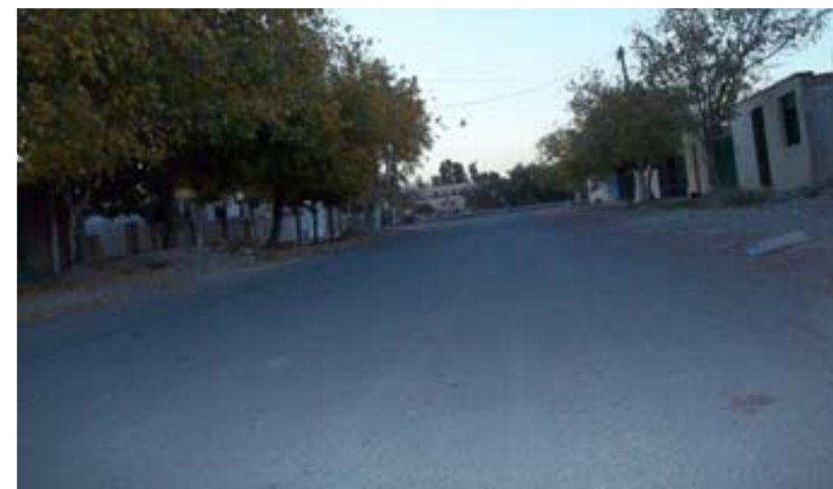
La calle Entre Ríos, entre San Francisco del Monte y Lateral de Avenida de Circunvalación, donde se realizaron trabajos de repavimentación.

Asimismo se emprendieron obras de repavimentación que abarcó las calles Telesfora; Jujuy, entre Paraguay y Cereceto; Aberastain, entre Juan Jufre y Chile; Paraguay, entre Caseros y Tucumán; Obreros Sanjuaninos, entre 9 de Julio y Arenales; Las Heras, entre Nuche y Arenales; Brasil, entre Conector Sur 15 de Octubre y Las Heras; Pedro de Valdivia, entre Avenida Rioja y Lavalle; Segundino Navarro, entre Córdoba y Avenida Ignacio de la Roza; Benja-