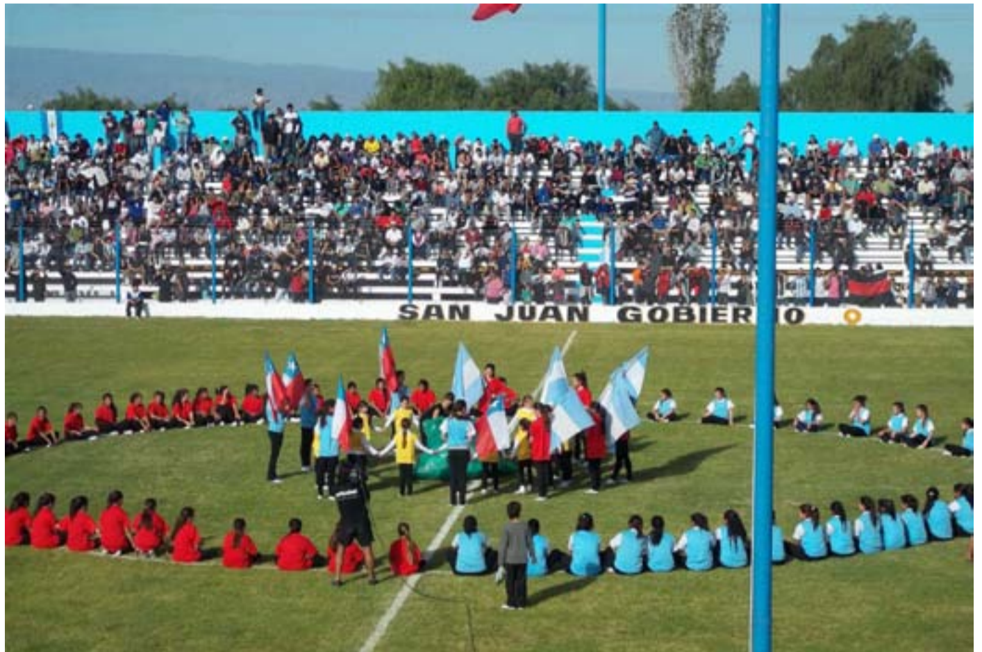
En la coreografía inaugural, protagonizada por niñas del departamento, primaron los colores de Argentina y Chile, con banderas de ambos países incluidas.