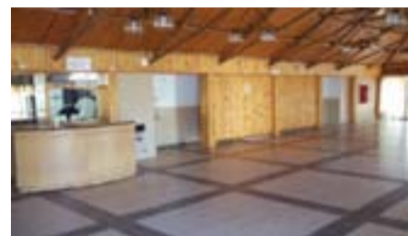
Salón de eventos