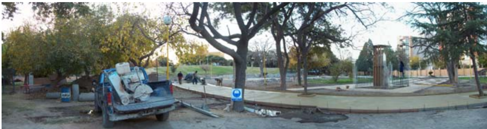
Vista panorámica de las obras que se están llevando a cabo en torno a la remodelación de la plaza Hipólito Yrigoyen

Todas estas obras en su conjunto más otros detalles se focalizan en un nuevo diseño para esta tradicional plaza de la provincia, bajo el recuerdo del "San Juan del pre-terremoto". En tal sentido se respetará la gruta con la Virgen y el Paseo de los Viñateros, que responden a la identidad de esta plaza.