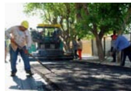
Personal del municipio, en pleno trabajo de repavimentación de los pasajes del Barrio Mitre.