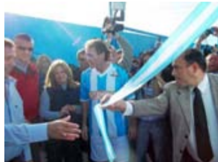
Autoridades provinciales, municipales y jugadores realizan el corte de cinta para dejar oficialmente inaugurado el Polideportivo de Albardón.