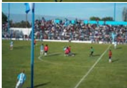
Momentos del partido entre Chile y Argentina.

En el primer tiempo, la selección de la Argentina comenzó a funcionar como un reloj en el medio campo y mucho tuvo que ver la sapiencia del "Negro" Hugo Ibarra, el aporte Alejandro Mancuso y el despliegue y la ductilidad de Mariano Pernía, comenzó a rendir sus frutos y los argentinos se adueñaron del centro de la cancha y generaron muchas jugadas que trajeron peligro al arco chileno que pudo dejar sin efecto el arquero.