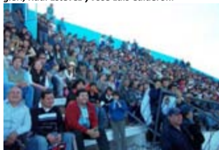
Las tribunas del Polideportivo de Albardón repletas de familias disfrutando del espectáculo deportivo