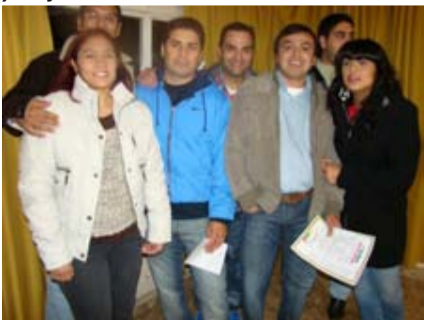
Delegados del Super Vea sucursal Alto del Bono Shopping.