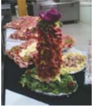
Mesa de fiambres – Lama

A 3.900 de altura los empleados combinaron la tarea diaria con los festejos por el día de la minería. En Veladero y en Lama se presentaron músicos y se preparó un menú especial para la celebración.