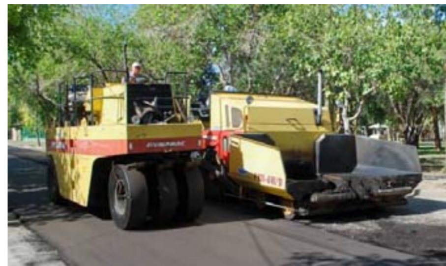
Los trabajos de pavimentación en el Barrio Frondizzi.

Un completo plan de pavimentación y repavimentación se está llevando a cabo en la Capital, mediante la Secretaría de Obras y Servicios Públicos del municipio. Durante los meses de enero, febrero, marzo y abril se ejecutaron importantes obras que venían siendo reclamadas por la comunidad desde hace tiempo y actualmente ya están terminadas.