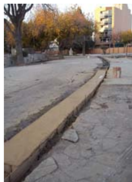
Detalles del nuevo diseño que tiene desde ahora la tradicional plaza sanjuanina.

PARA LAS OBRAS DE REMODELACIÓN DE LA PLAZA HIPÓLITO YRIGOYEN, LA MUNICIPALIDAD DE LA CAPITAL CUENTA CON EL RESPALDO DE LA CÁMARA MINERA DE SAN JUAN Y LA EMPRESA XTRATA COPPER, QUE ASUMIERON EL PADRINAZGO DEL ESPACIO VERDE.