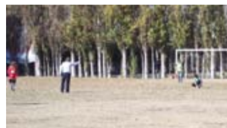
Cancha de fútbol