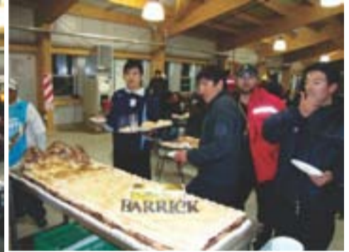
Festejos en el comedor Los Amarillos – Lama

Una jornada soleada y un cielo despejado fue el marco de la celebración en donde todos los trabajadores de Barrick y sus contratistas disfrutaron de un agasajo gastronómico. En la mina Veladero se presentaron músicos sanjuaninos que amenizaron la cena de los “nocheros”, (trabajadores que realizan sus tareas durante el turno noche) y del resto de los trabajadores, muchos de ellos recién llegados para cumplir su turno. Mientras que en Lama la cena también tuvo un menú especial y la actuación de un grupo musical folklórico.