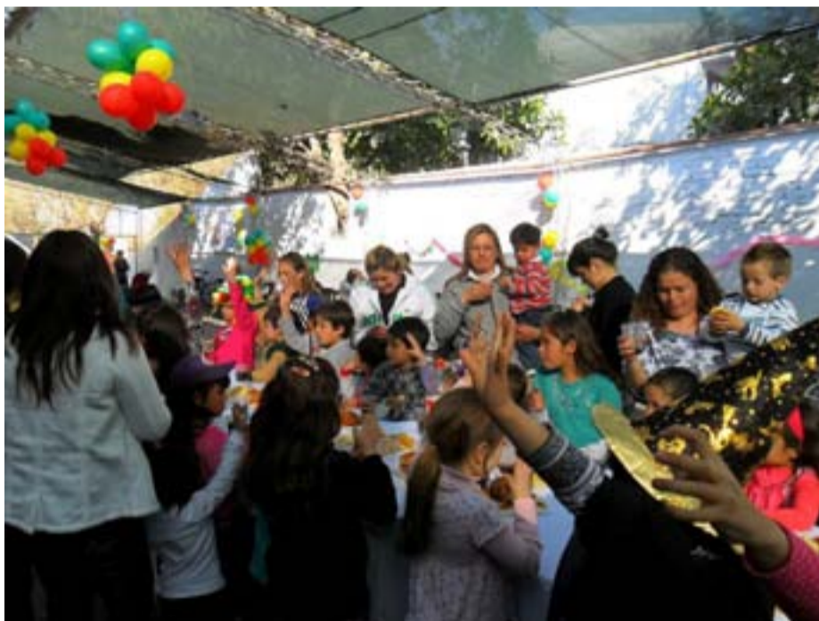
Festejando el Día del Niño, junto a los hijos de los afiliados.