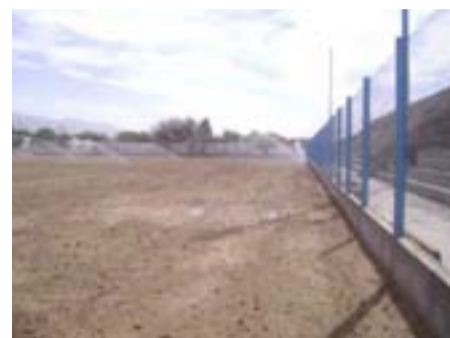
Instalación del sistema de riego por aspersión.