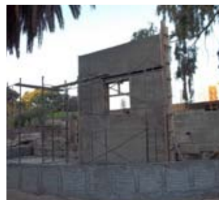
Aquí se está construyendo la fuente que tendrá la plaza. Será una de las mayores atracciones del espacio verde.