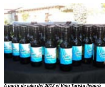
A partir de julio del 2012 el Vino Turista llegará a los restaurantes de todo el país. El producto no costará más de $25 la botella.

En el Salón de Presidencia del INV Instituto Nacional de Vitivinicultura de la Ciudad de Mendoza, se firmó el Convenio de "Vino Turista", un compromiso asumido con la Federación de Empresarios Gastronómicos de la República Argentina.