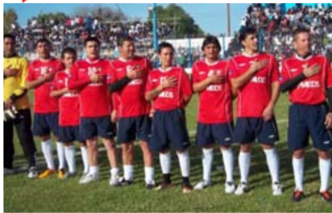
ARRIBA IZQUIERDA: La selección de Chile, entonando el himno de su país.