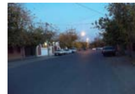
La calle Aberastain repavimentada, entre calles Juan Jufre y Chile.