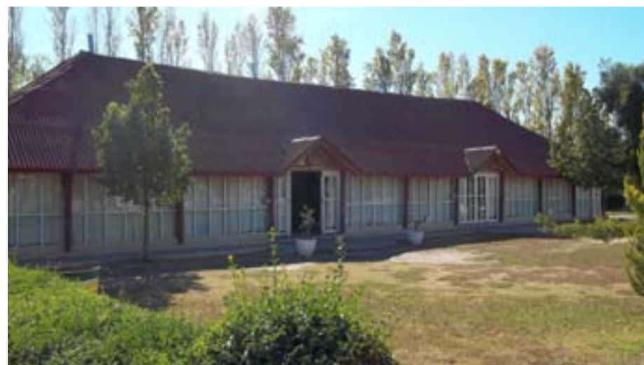
Quincho para eventos sociales