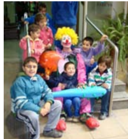
Programa "Integrándonos por un mundo mejor".