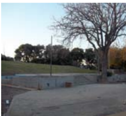
También se está arreglando el anfiteatro natural.