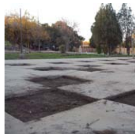
Paseo de los Viñateros,

PARA LAS OBRAS DE REMODELACIÓN DE LA PLAZA HIPÓLITO YRIGOYEN, LA MUNICIPALIDAD DE LA CAPITAL CUENTA CON EL RESPALDO DE LA CÁMARA MINERA DE SAN JUAN Y LA EMPRESA XTRATA COPPER, QUE ASUMIERON EL PADRINAZGO DEL ESPACIO VERDE.