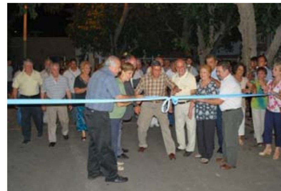
La calle Jujuy, entre Paraguay y Cereceto, repavimentada

PESOS SE INVIRTIÓ EN OBRAS DE REPAVIMENTACIÓN.