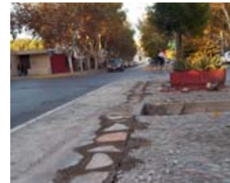
Renovación de pisos en boulevard de Avenida Córdoba, entre calle Güemes y Caseros.