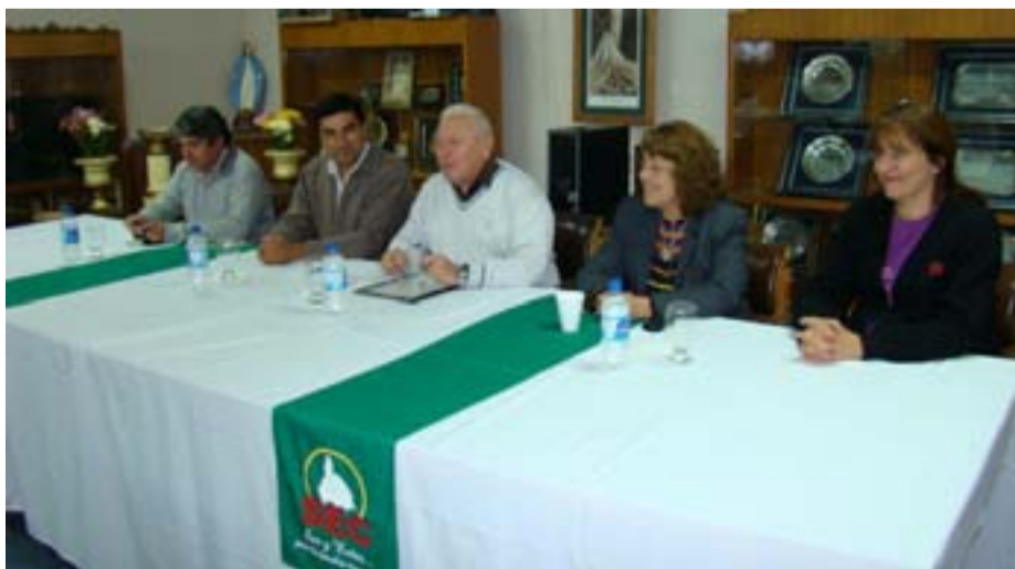
Firma de convenio con Super VEA.