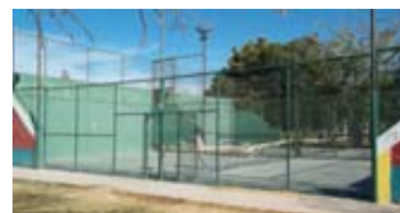
Cancha de paddle.