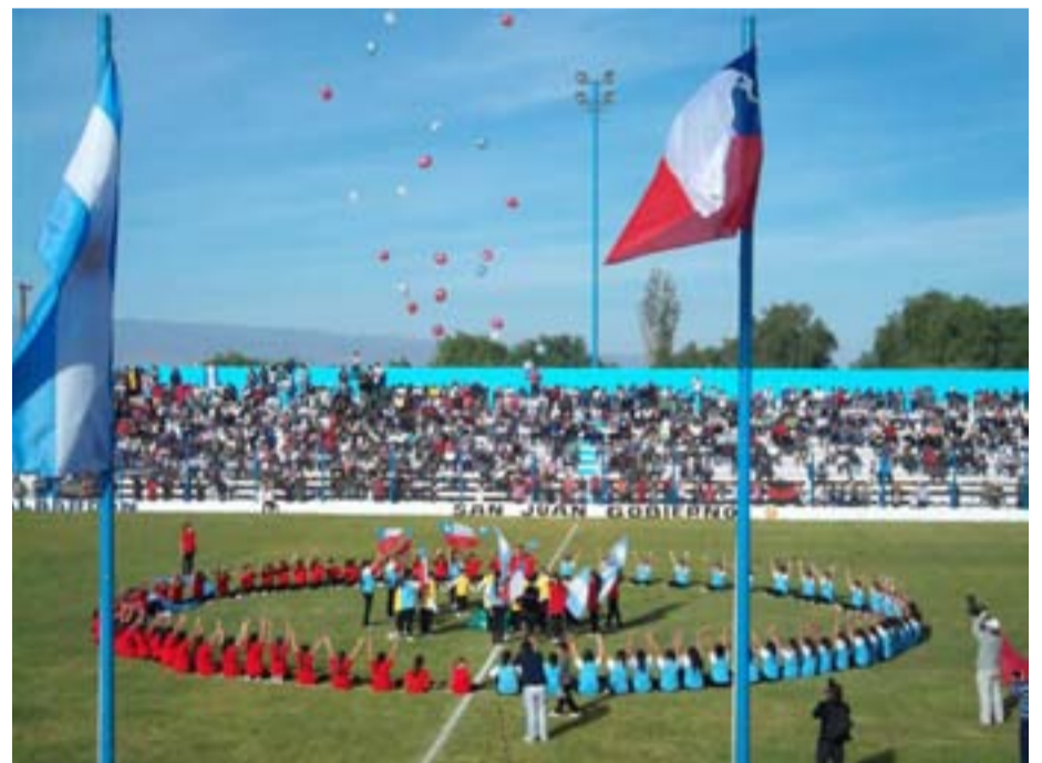
El momento más emotivo del show inaugural: cuando globos rojos, plateados y celestes volaron por el aire, mientras flameaban las banderas de Argentina y Chile y el público ovacionaba por el gran espectáculo vivido.