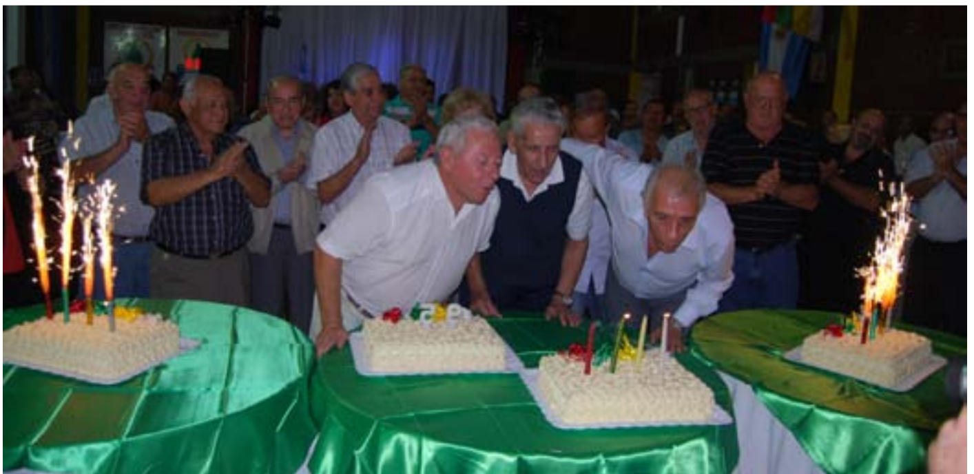
Avila junto a dirigentes del SEC, festejando un nuevo aniversario del gremio.