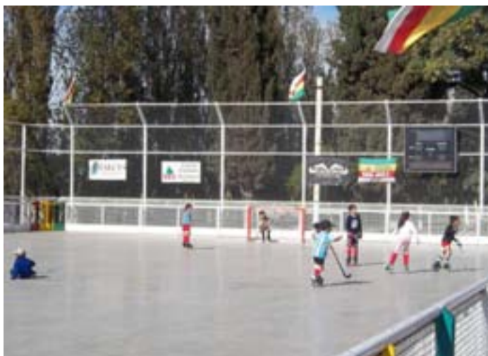
Cancha de hockey.