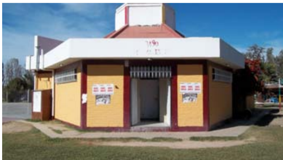
Ingreso baño de caballeros.