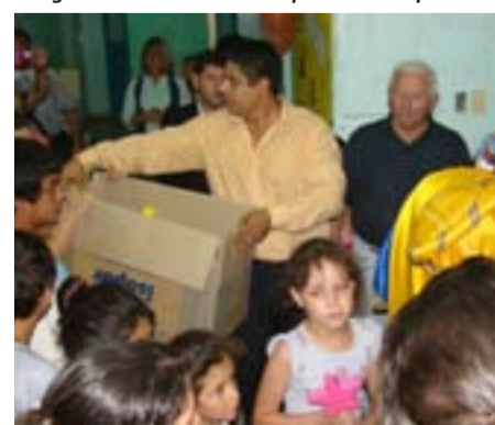
Entrega de juguetes en el Hospital de Albardón.