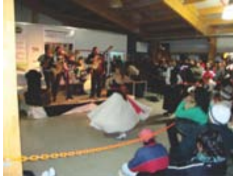
Grupo Los arrieros y pareja de baile – Lama