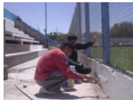
El predio comenzaba a tomar color, con las primeras manos de pintura.