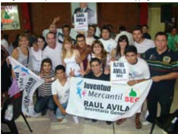
Los integrantes de la juventud mercantil.