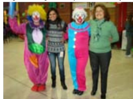
Las dirigentes gremiales junto a los payasos que integraron a los niños con capacidades especiales