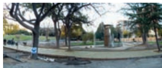
Obras de remodelación en la Plaza Hipólito Yrigoyen.

La ciudad de San Juan sigue creciendo en infraestructura con importantes obras públicas.