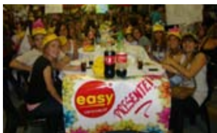
Las empleadas de Easy, festejando el Día de la Mujer.