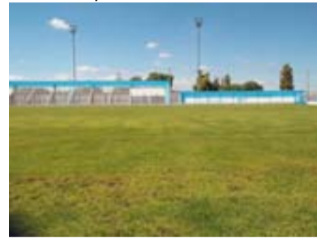
El Polideportivo terminado, con todas las obras proyectadas.

Todos los pasillos laterales hacia el portón de acceso se trabajaron con hormigón rodillado.