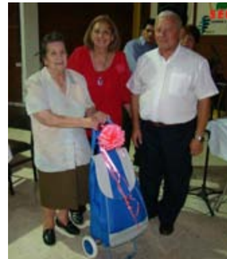
Entrega de premios para las mercantiles jubiladas al Festejar el Día Internacional de la Mujer en el SEC.

Desde la secretaría Secretaria de la Mujer cada una de las metas se procura la participación activa de las mujeres en el mundo sindical.