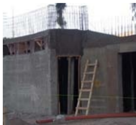
Los grupos de sanitarios, en plena construcción