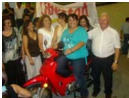
Más premios para las empleadas de comercio, en esta oportunidad en el gran festejo del Día de la Mujer que se realizó en marzo.