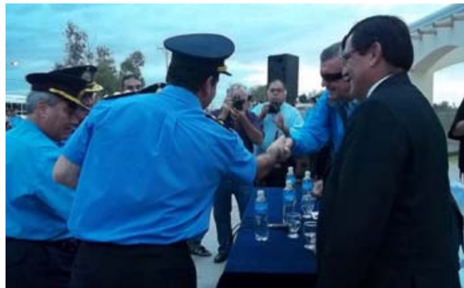
Entrega de llaves de las movilizaciones para la Policía de San Juan.