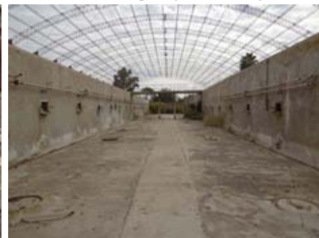
Diversos trabajos se llevarán a cabo en la ex bodega El Parque. La idea es transformarla en una bodega boutique, donde puedan ofrecerse servicios de hotelería e instalar un museo del vino.