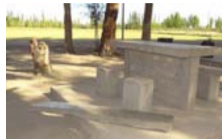
Un grupo de vándalos destruyeron las instalaciones del camping municipal, es por ello que Elizondo dijo que deberá ponerse en sereno en el lugar para evitar este tipo de destrozos.

Respecto a las obras de remodelación que se están realizando en el Camping