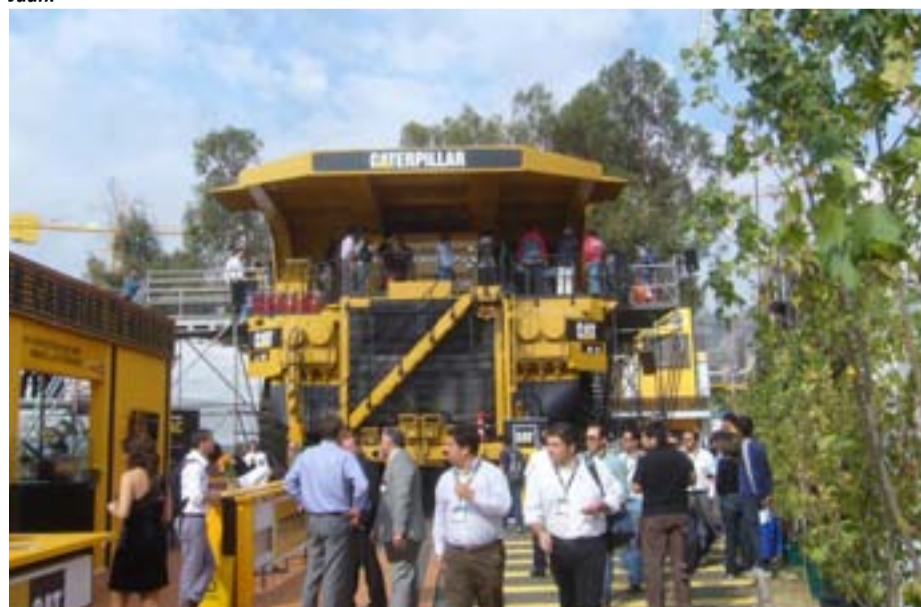
Exposición de grandes equipos (CAT)