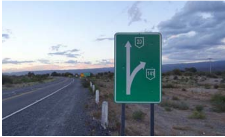
Dentro del Plan Estratégico de Caucete, se incluye las mejoras viales en los caminos y rutas de acceso al departamento.