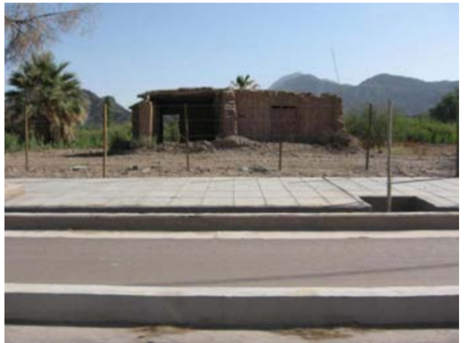
Huaco - Ruta 40

$5.900.000 ES LA INVERSIÓN TOTAL PARA LA CONSTRUCCIÓN DEL MICRO-HOSPITAL DE JACHAL.