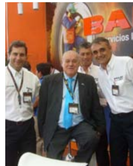
Felipe Saavedra, ministro de Minería de San Juan, con empresarios.