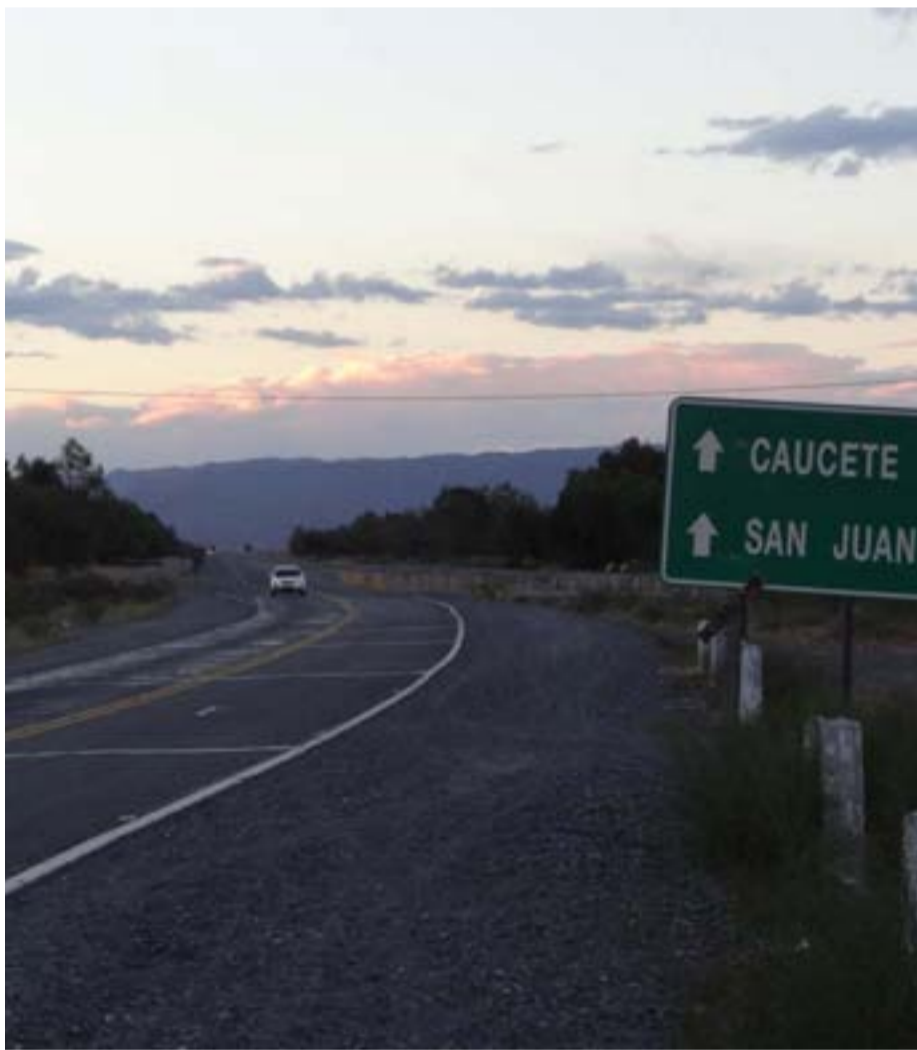
El próximo 27 de abril un año más Caucete vivirá la gran fiesta gaucha, con la nueva edición de la Cabalgata de Fe a la Difunta Correa. Para ello se han encarado mejoras en la Ruta 20.