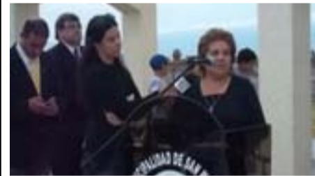
Una vecina de Vía Dominguito agradece al intendente Santibañez y al gobernador Gioja por las obras realizadas en el lugar.