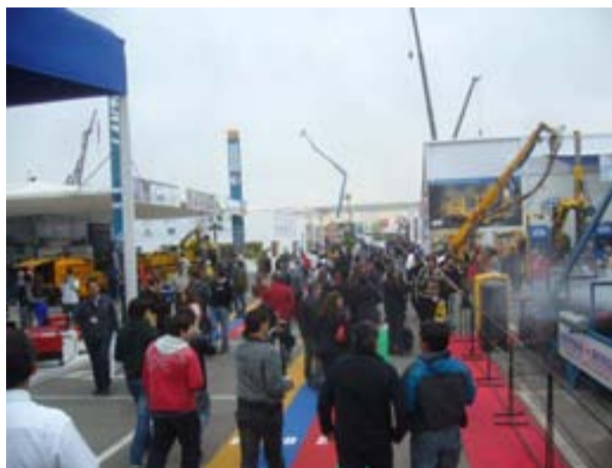
Mil quinientos expositores. 35 países representados. Más de 60 mil asistentes.