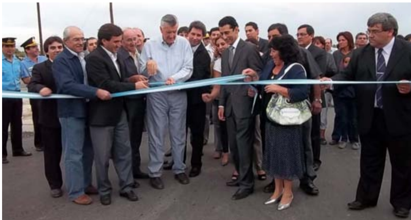
Momento en que se deja inaugurado el pavimento del Barrio Dos Acequias

Además se entregaron motos a la Policía de San Juan para reforzar la seguridad en el departamento y se firmó un convenio entre el municipio, Obras Sanitarias Sociedad del Estado (OSSE) y el Instituto Provincial de la Vivienda (IPV) para iniciar las obras correspondientes al Sistema Cloacal de de la Zona Centro de San Martín.