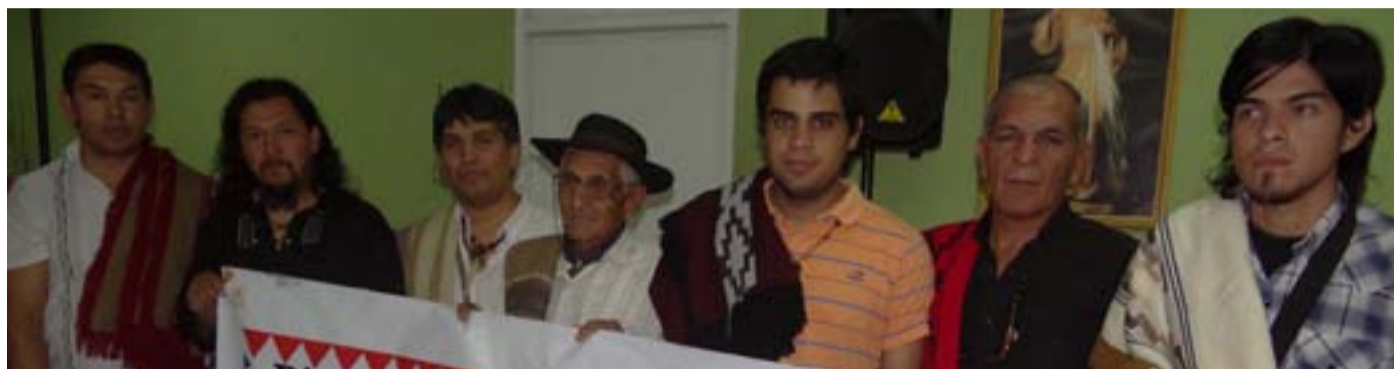
Integrantes de la Organización Territorial huarpe Pinkanta de San Juan, Mendoza y San Luis, en el municipio de Caucete.

Será realizado el denominado Encuentro Nacional de Organizaciones Territoriales de Pueblos Originarios (ENOTPO), bajo el lema "La política indígena en manos de los pueblos indígenas". Previo a ello hubo una reunión del Pueblo Huarpe que organiza el evento.