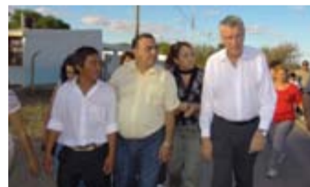
Días atrás visitó Caucete el gobernador José Luis Gioja. En la oportunidad se inauguró obras de pavimento, se entregó indumentaria deportiva y movibilidades para la Policía y se firmó un convenio con OSSE.