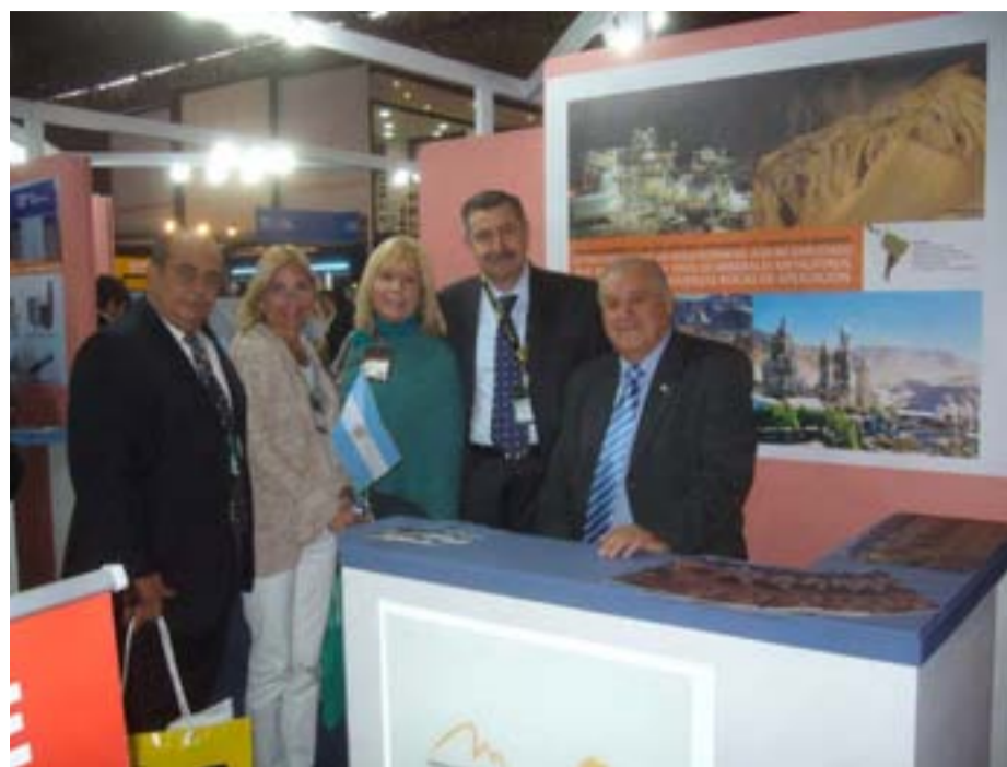
El ministro Saavedra con empresarios argentinos

El Ministro Saavedra tuvo en agenda para los siguientes días de extensión de la feria, que culminó el pasado viernes, diversas reuniones con empresarios internacionales, ocasión que será oportuna para detallar los múltiples nichos