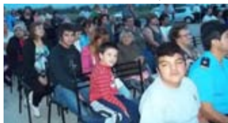
Los vecinos de Dos Acequias, reunidos en el CIC donde se llevó a cabo el acto, en la visita del gobernador José Luis Gioja.