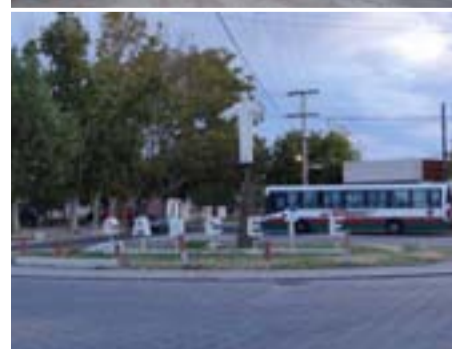
Se está trabajando en la repavimentación de varias calles del departamento como la calle Rawson, desde Diagonal Sarmiento hasta Juan José Bustos.