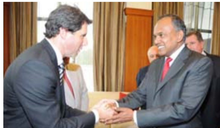
Uñac se reunió con el ministro de Comercio Exterior de Singapur

Uñac participa, en representación de la provincia, de la Feria de Alimentos y Hoteles de Asia que se realiza en ese país junto a enviados de Mendoza, La Rioja y Catamarca. Previamente, visitó el reino de Dubai. Satisfacción de los empresarios que lo acompañan por las posibilidades de negocios que se abren con Oriente.