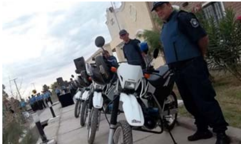
Las motos donadas a la Policía de San Juan son marca Honda, modelo XR250 Tornado.