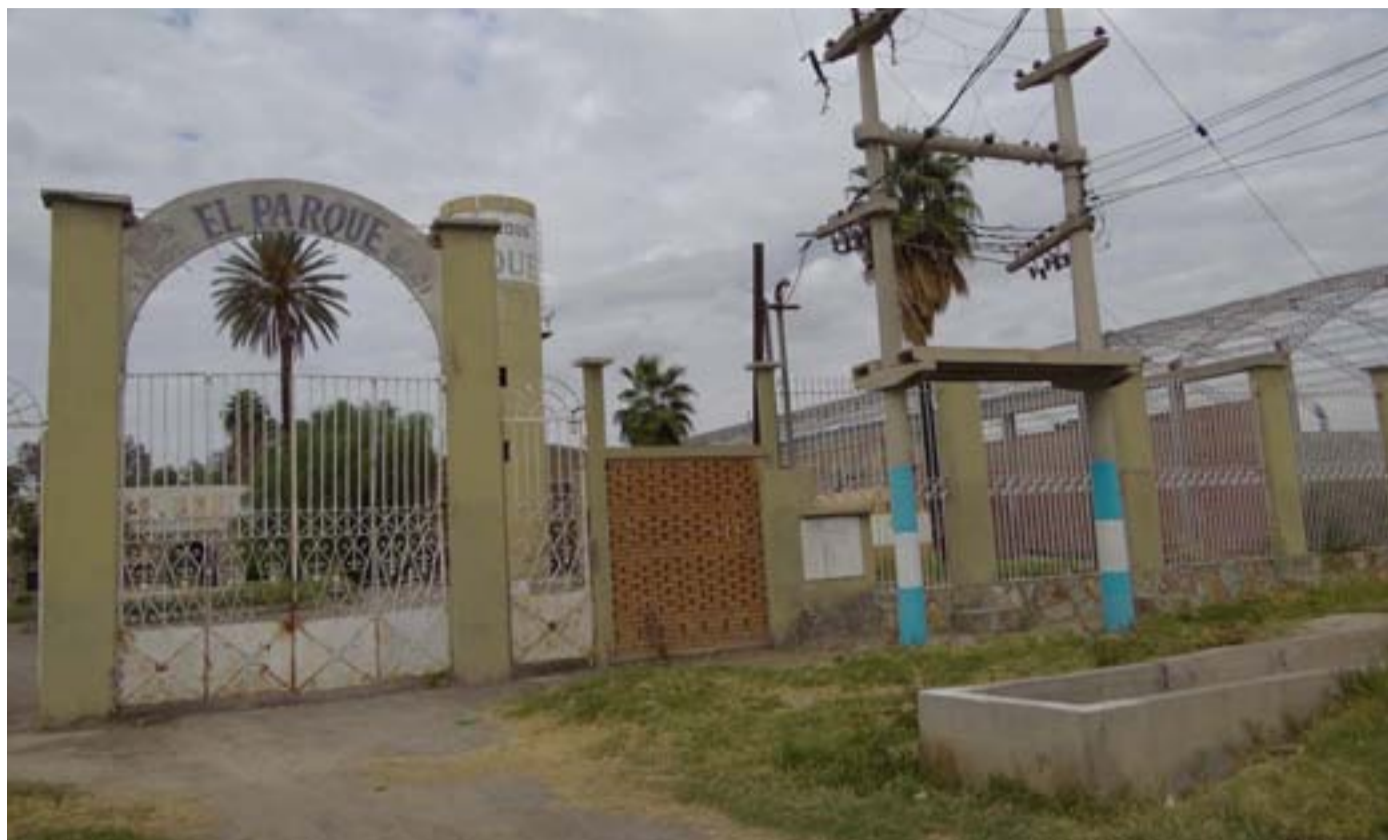
Las instalaciones de la ex bodega El Parque, sujetas a obras de remodelación.