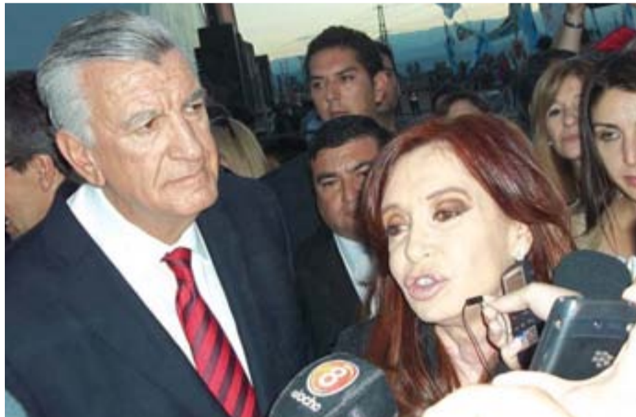
Tras culminar el acto en la Planta de Energía Solar en Cañada Honda, Sarmiento, la presidenta Cristina Fernández, acompañada por el gobernador José Luis Gioja brindó declaraciones a la prensa local.