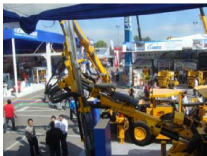
Exposición de equipos de última generación para perforación

El avance en las obras de Lama – Pascua, la perspectiva de factibilización de Pachón y el sostenido crecimiento de la actividad tanto metalífera como no metalífera fueron los aspectos más atractivos para los empresarios trasandinos con relación a San Juan. Al final de la jornada el titular de la cartera minera provincial participó del copetín ofrecido por el Embajador de Argentina en Chile, Ginés González, que contó con la presencia del Presidente de la Cámara de Proveedores Mineros de Chile, entre otras destacadas figuras del quehacer minero trasandino.