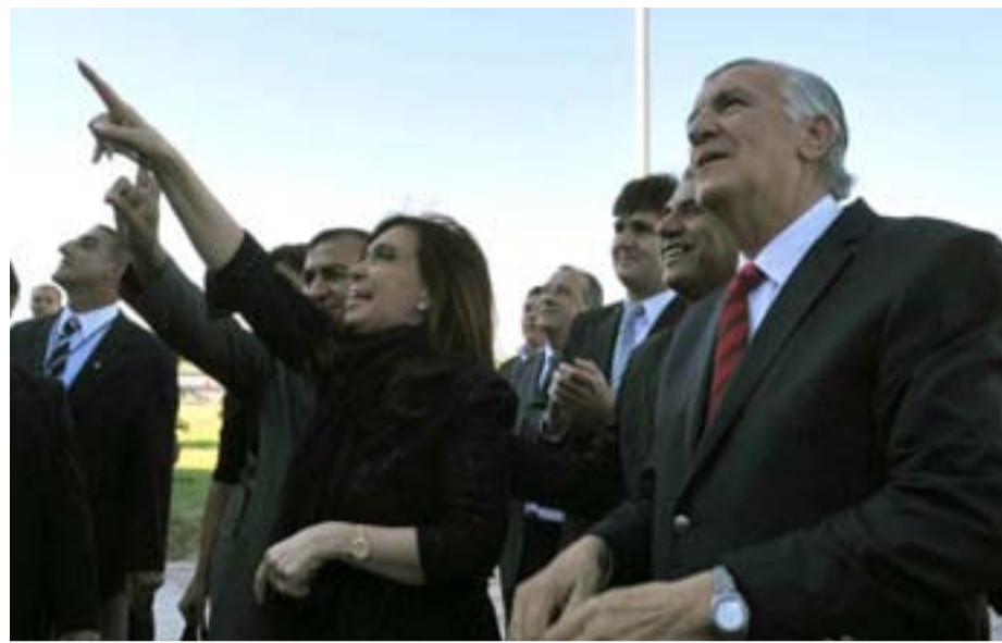
En su arribo a la provincia, Cristina y Gioja saludan a militantes y sanjuaninos en general que la recibieron en el aeropuerto provincial

bernador José Luis Gioja el convenio para la construcción del Teatro del Bicentenario en la capital provincial.