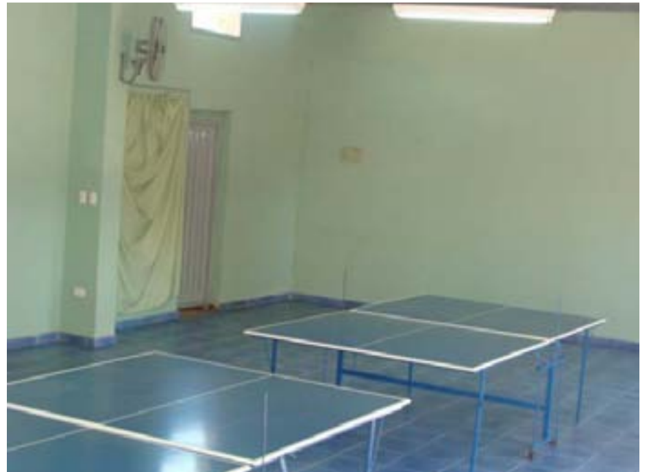
El equipamiento del polideportivo, todo adaptado para personas con capacidades diferentes.