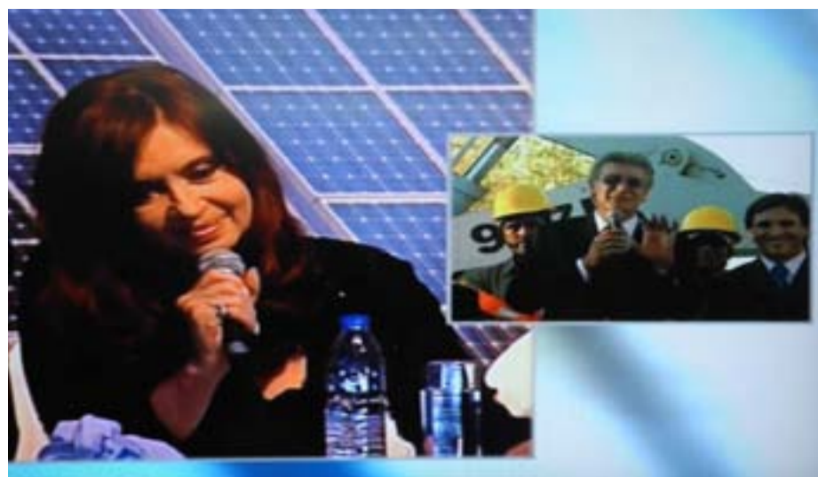
La presidenta Cristina Fernández dialoga mediante videoconferencia con el intendente de Rawson Juan Carlos Gioja.

También se construirán ocho talleres de teatro, tapicería, disfraces, decorados, iluminación, y arcilla; áreas de apoyatura a músicos, artistas y talleres; un patio de comidas, restaurante, confitería, snack y las áreas de administración.