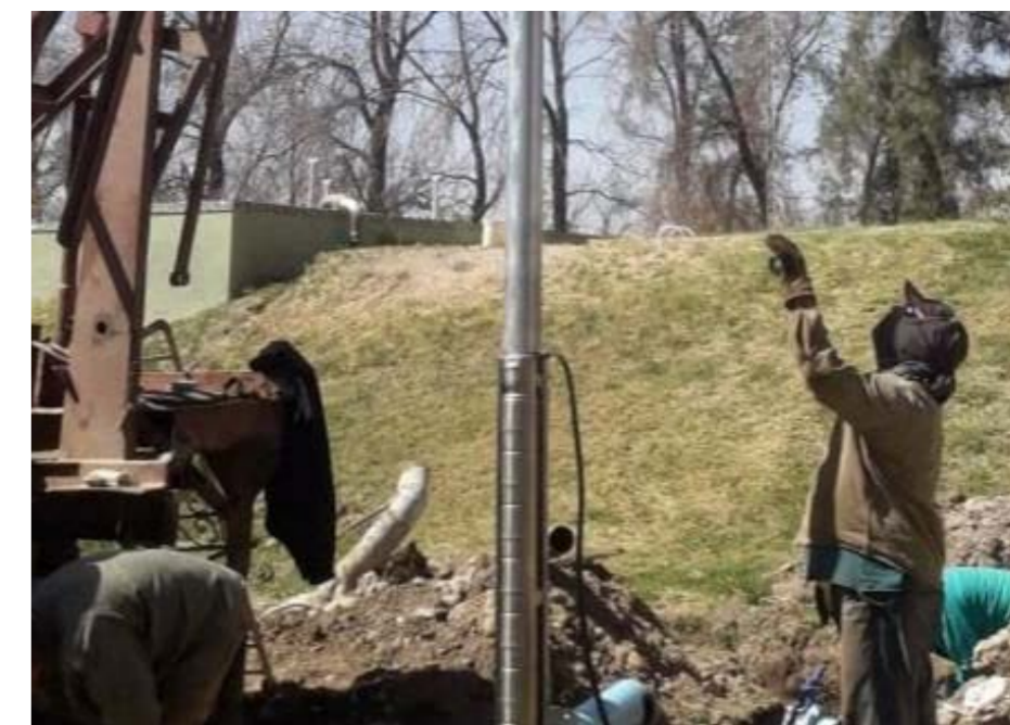
La nueva electrobomba es de 45 Hp, es decir, tres veces más potencia que la anterior que era de 15 Hp. Lo que va a significar más caudal a la red, más presión y mejor servicio.

ta potabilizadora se quemó y eso trajo aparejado restricción del servicio en casi todo el departamento. “Para que nadie se quedara sin servicio estuvimos durante todos estos días abriendo y cerrando llaves para regular la presión de agua en la red”, contó Correa. “Yo agradezco enormemente la