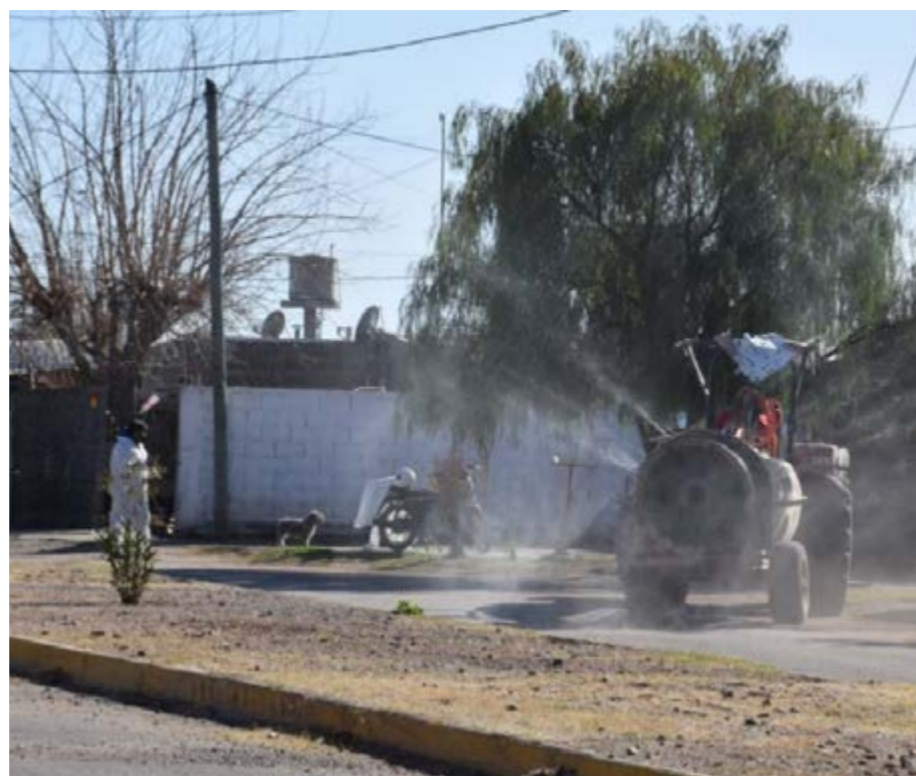
San Agustín. Allí el personal municipal realiza trabajos de limpieza a toda la mercadería para el posterior abastecimiento de los comerciantes locales.

Desde la comuna indicaron que “con esta campaña se llegará todas las localidades del departamento con el objetivo principal cuidar y priorizar la salud de los vallistas”. A su vez, la municipalidad también ejecuta operativo de desinfección a los camiones abastecedores en Astica y Villa