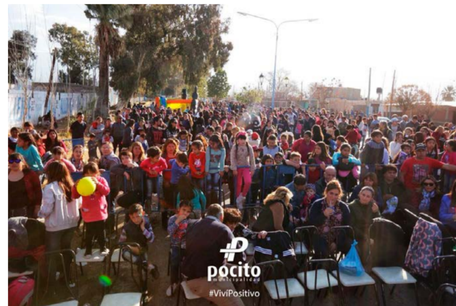
El domingo, se realizó el Chocolate Gigante de la Municipalidad de Pocito en el barrio Chubut, en el distrito de Car-

pintería. Miles de niños se acercaron a disfrutar de todo el show y la diversión preparada para festejar el mes del niño.