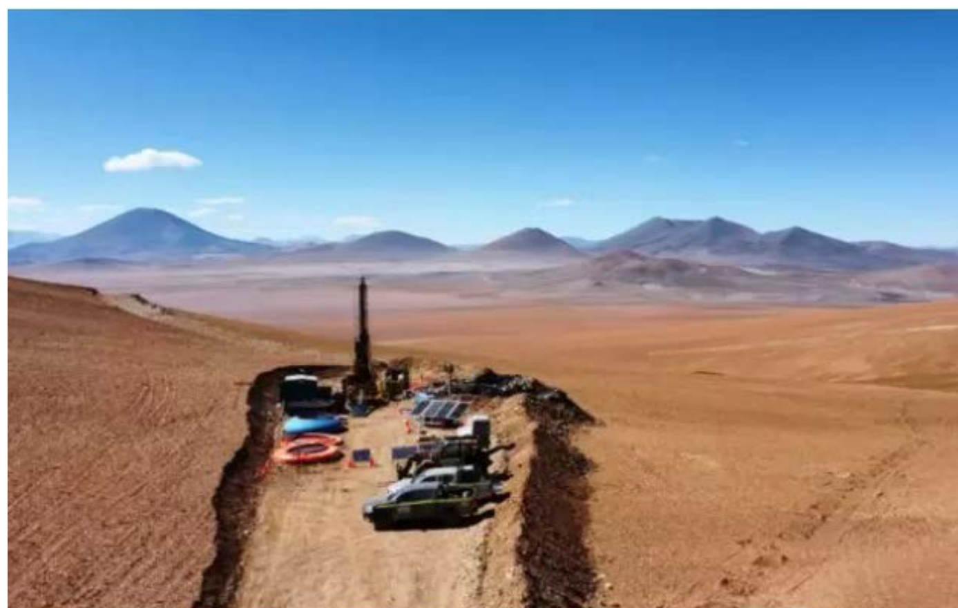
El Pachón, aproximadamente a 30 km al sur, la mina de cobre en operación

En noviembre de 2023, la Compañía adquirió una participación en Piuquenes, de propiedad privada, adyacente (al norte) al proyecto Altar y aproximadamente a 190 km al oeste de la ciudad de San Juan. Otros grandes proyectos de pórfido de cobre en el cinturón de pórfido del Mioceno de San Juan incluyen