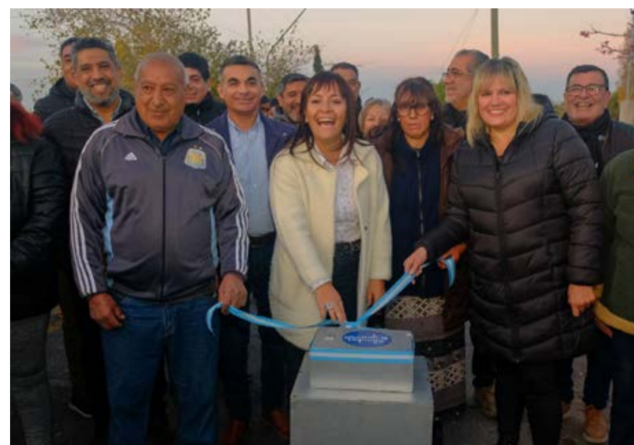
manera se logra una mejor visibilidad para conductores, peatones y colabora brindando mayor seguridad a quienes viven en el sector.

Dicha obra, sumamente esperada por los vecinos de la zona como así también por quienes diariamente circulan por el lugar, se realizó con fondos mixtos provenientes del FODERE y de las arcas municipales, quien a su vez aportó la mano de obra, con trabajadores municipales, para la realización de la misma. Respecto a la inversión fue de $140.000.000 La misma se encuentra en un lugar emblemático del departamento como es la zona este, específicamente la localidad de El Mogote. Allí se instalaron 100 lámparas led de 150 watts, haciendo un total de 4 km de extensión. De esta