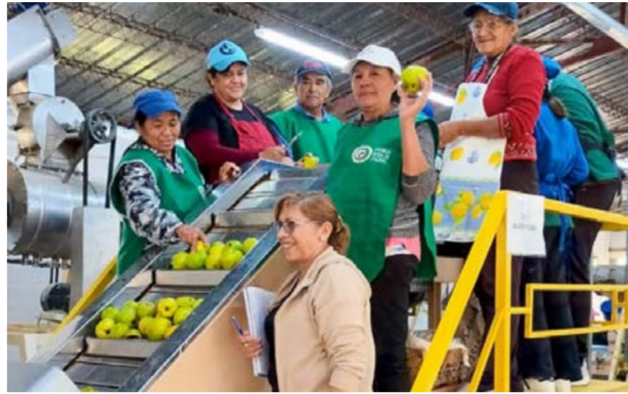
Desde la Municipalidad de Jáchal informaron que "estas instancias buscan vincular a productores con alumnos en práctica, generando un intercambio de saberes enriquecedor. Los estudiantes aportan sus conocimientos técnicos, mientras que los productores comparten su experiencia práctica, que luego se traduce en los productos finales".

"La materia prima utilizada fue gestionada por la Municipalidad de Jáchal y miembros de la asamblea rural, implicando un esfuerzo conjunto por impulsar la producción local. Destacamos la